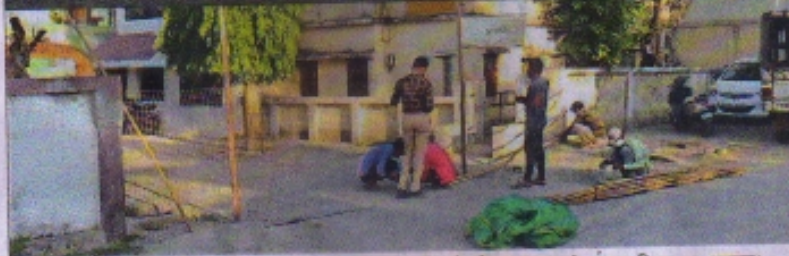
अलकापुरी अंधे चौक के पास वाली गली को मंगलवार को कंटेनमेंट बनाकर बंद करता निगम का अमला।

शहर में इन इलाकों में बने माइक्रो कंटेनमेंट एरिया