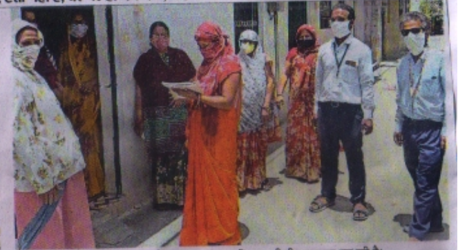
शहर में इस तरह स्वास्थ्य विभाग और महिला एवं बाल विकास की टीम पूछताछ कर रही है।