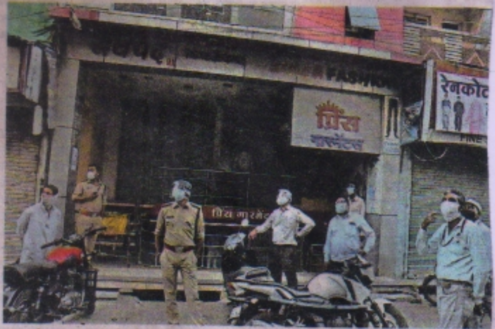
माणकचौक स्थित स्टाइल एंड फैशन की दुकान को सील करवाते जिला प्रशासन और पुलिस प्रशासन के अफसर।

यह दुकान माणकचौक थाने से महज 50 मीटर दूर है। संबंधित दुकान खुली मिलने पर पुलिस ने इसी व्यापारी के खिलाफ 3 मई को एफआईआर दर्ज की थी। इसके बाद भी व्यापारी पर कोई फर्क नहीं पड़ा और पुलिस की कार्रवाई से बेखौफ होकर कपड़ा व्यापारी ने दुकान खोल ली। इस पर आखिरकार जिला प्रशासन को संबंधित दुकान सील करना पड़ी।