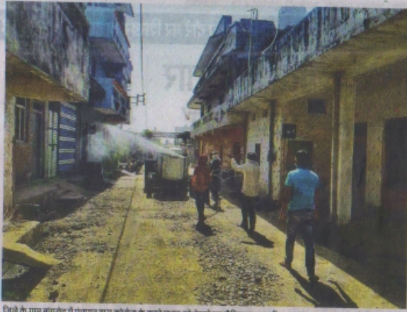
जिले के ग्राम बागरोद में पंचायत द्वारा कोरोना के बढ़ते प्रभाव को देखते हुए सीमादहजर का डिडकार कराया गया। • नईदुनिया

रतलाम (नईदुनिया प्रतिनिधि)। जिले के गांवों में कोरोना के ज्यादा मामलों आने के बाद अब प्रशासन ने पांच से ज्यादा मरीज होने पर पूरे गांव को कंटेनमेंट ज़ोन बनाने की बखर्चाई शुरू कर दी है। इसमें गांव में अलावाजही बंद कर कोरोना गडबड-लॉकडाउन का पालन भी सख्ती से कराया जाएगा। प्राथमिक तौर पर जिले के 66 ग्राम पंचायतों में पांच से ज्यादा मरीज हैं, इसमें रतलाम जनपद में आने वाले गांवों की संख्या सर्वाधिक है। बिलपांक में सबसे ज्यादा करीब 240 मरीज हैं। इसके अलावा सैतना व पिपलीदा में भी मरीजों की संख्या ज्यादा है जबकि आलोट, जावर व बाजना जनपद के गांवों में मरीज कम हैं।