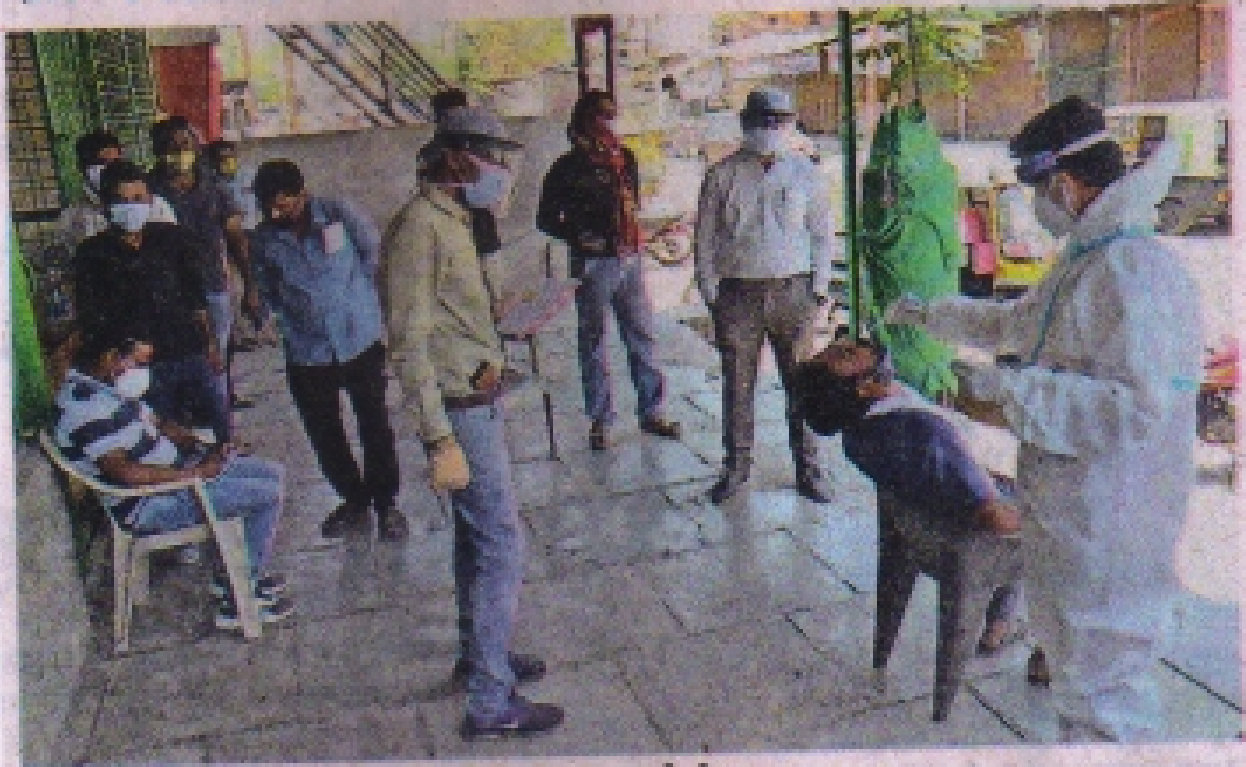
हरमाला रोड पर फल विक्रेता और कर्मचारियों की जांच करती टीम।

फल व्यापारी सहित 18 कर्मचारियों की स्वास्थ्य अमले ने की जांच