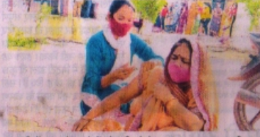
करमवी में वृद्ध को चलने में परेशानी को देख बाहर आकर लगाया टीका।

टीकाकरण के इस कार्य को लेकर भी प्रशासन ने पहले डोज के लिए मतदान केंद्रवार टीकाकरण की व्यवस्था की थी। सेकंड डोज के लिए 5 सत्र स्थल निर्धारित थे और स्लॉट बुकिंग के लिए 2 सत्र स्थल निर्धारित किए गए थे। पहले डोज के लिए सभी नागरिक इस व्यवस्था के