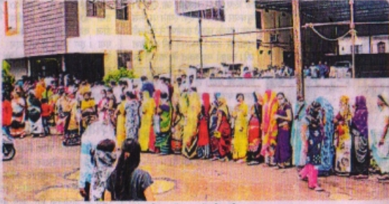
टीकाकरण केंद्र के बाहर वैक्सीन लगवाने महिला और पुरुषों की लंबी कतार।

रतलाम @ पत्रिका, जिले में 4 दिनों के बाद बुधवार को टीकाकरण के प्रथम डोज के लिए 13 सत्र स्थल निर्धारित किए गए थे जिसमें 66 मतदान केंद्रों के रहवासियों का वैक्सीनेशन हुआ। कुछ केंद्रों पर हितग्राहियों की कतार लगी, नजर आई तो कुछ एक स्थान पर प्रिनती के लोग नजर आए।