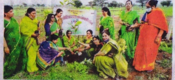
छात्राध्यु अभियान के तहत पौधारोपण करती महिलाएं।