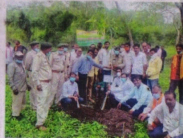
सातठंडा केवलका माता मंदिर फाड़ी क्षेत्र में पौधा लगते डीएस डोहरे आदि।