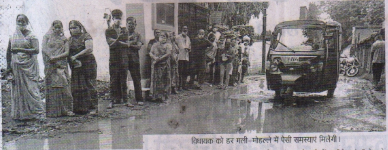
विधायक को हर गली-मोहल्ले में ऐसी समस्याएं मिलेंगी।

रतलाम, नप्र। शहर की सड़कें कितनी खराब हैं, यह तो सड़कों पर चलने वाले ही भलीभांति जानते हैं। सड़कों की खराब हालत को लेकर आए दिन बात होती रहती है, लेकिन सुध लेने की किसी को सूझ नहीं पड़ती।