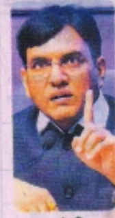
मनसुख मंडाविया, केंद्रीय स्वास्थ्य मंत्री

केंद्रीय स्वास्थ्य मंत्री मनसुख मंडाविया ने कहा है कि देश में टीकों की कोई कमी नहीं है, लेकिन राज्य सरकारें और कई नेता अपने बयानों से इस बारे में लोगों में घबराहट फैला रहे हैं। उन्होंने बताया कि केंद्र सरकार राज्यों को कितने टीक कब मिलेंगे इस बारे में काफी पहले से जानकारी दे देती है। मंडाविया ने बुधवार को कहा, सरकारी-निजी अस्पतालों को जून में 11.46 करोड़ डोज राज्यों को उपलब्ध कराई गई। जुलाई में डोज को बढ़ाकर 13.50 करोड़ किया है। इसके बावजूद हमें कुप्रबंधन और वैकसीन के लिए कतारें दिख रही हैं तो यह बिल्कुल स्पष्ट है कि समस्या क्या है और इसकी वजह कौन है।