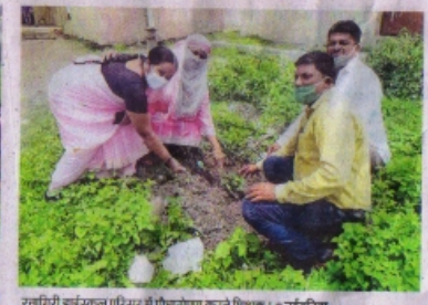
रवागिरी हाईस्कूल परिसर में पौधारोपण करते शिक्षक।