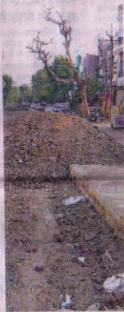
शास्त्री नगर रोड को चौड़ा करने खोदी सड़कें में मुरम की जगह काली मिट्टी का भरवा किया जा रहा है।

ठहराव प्रस्ताव पारित कर कार्रवाई के लिए नगरीय प्रशासन एवं विकास विभाग को लिखा था पत्र