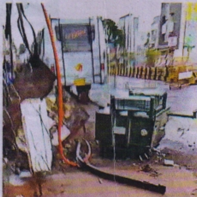
फव्वारा चौक पर गिरा ट्रांसफार्मर।

शुक्रवार शाम को हुई बारिश के साथ ही आधे शहर की बिजली बंद हो गई। शहर में 36 ट्रांसफार्मरों के जरिए बिजली की सप्लाई होती है लेकिन बारिश और हवा के साथ ही इसमें से 20 ट्रांसफार्मर बंद हो गए और शहर की बिजली सप्लाई व्यवस्था ठप हो गई। आधे घंटे में इन ट्रांसफार्मरों से सप्लाई शुरू हुई। लेकिन चार ट्रांसफार्मरों की बिजली सप्लाई ढाई घंटे तक ठप रही। इससे लोग भीषण गर्मी में परेशान होते रहे। बिजली कर्मचारी मौके पर पहुंचे और लाइन की मरम्मत की तब कहीं जाकर बिजली चालू हो पाई।