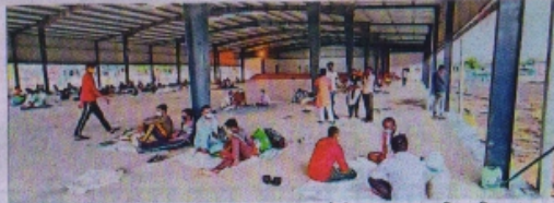
मेडिकल कॉलेज का तंबू भीगने से मरीजों के परिजन को विधायक सभागृह शिफ्ट किया गया।

भारतीय मौसम विभाग ने 31 मई को मानसून केरल में पहुंचने की बात कही है। 4 दिन कम या ज्यादा हो सकते हैं। इधर, केरल पहुंचने के औसतन 23 दिन बाद रतलाम में मानसून आ जाता है। यदि कोई सिस्टम प्रभावित नहीं करता है, तो इस मान से 28 जून के पहले ही मानसून की दस्तक रतलाम में हो सकती है। हमारे जिले में प्री-मानसून एक्टिविटी होने लगी है, पिछले साल मई के अंत से ऐसा हुआ था। पिछले साल 1 जून को केरल में मानसून ने दस्तक दी थी। रतलाम में 23 जून को मानसून आया था।