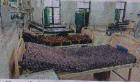
मेडिकल कॉलेज के ट्राएज एरिया के बेड रविवार को 64 दिन बाद खाली हो गए। यहां मरीजों का प्राथमिक उपचार किया जाता है।

ग्रामीण कोविड सेंटर खोलने का भी बड़ा असर... मेडिकल कॉलेज का लोड कम हुआ