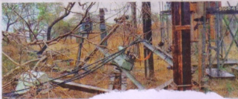
आंधी से क्षतिग्रस्त होकर गिरे बिजली पोल