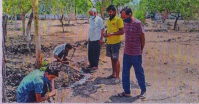
जवाहर नगर मुक्तिधाम के सामने जमीन पर बगीचे को संवारते हुए क्षेत्र के युवा।

श्रमदान : जवाहर नगर मुक्तिधाम के सामने की पहल, फलदार पौधे भी लगाए