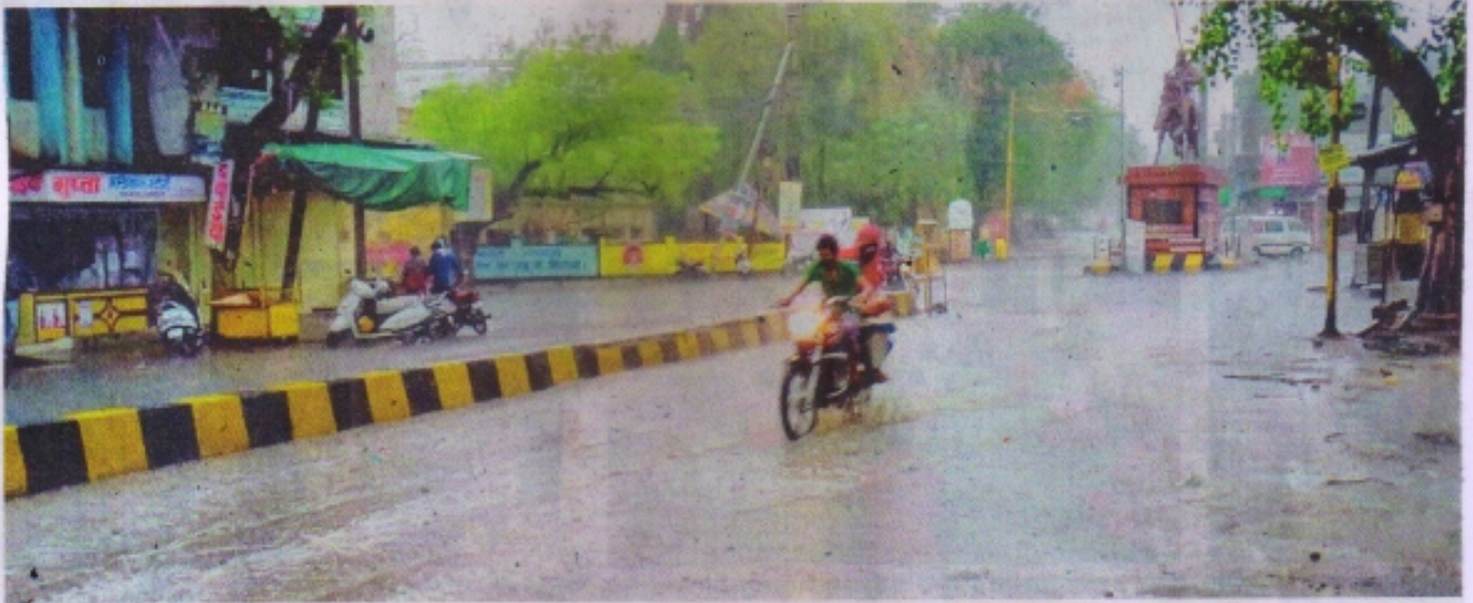
रतलाम में रविवार शाम तेज बारिश के दौरान आवाजाही करते हुए वाइक सवार। •नईदुनिया 17 5 21

दिनभर तेज गर्मी के बाद शाम को तेज बारिश, मौसम का सबसे गर्म दिन रहा, उमस बढ़ी