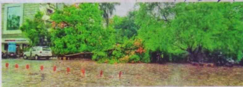
आंधी से रतलाम में कई स्थानों पर पेड़ धराशायी हो गए।