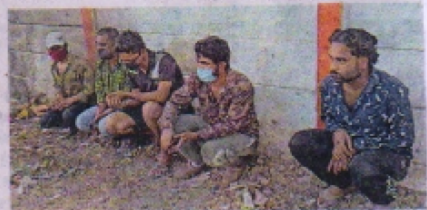
लोकेन्द्र भवन में अस्थायी जेल में बैठे पकड़े गए लोग।

एसडीएम अभियेक गेहलोत ने बताया शहर में कोरोना कर्फ्यू चल रहा है। इससे घर से बाहर निकलने पर भी पाबंदी लगाई गई है। इसके बावजूद लोग बेवजह घूमते मिले हैं। इन्हें हमने अस्थायी जेल भेजने के साथ ही इनके कोरोना के टेस्ट कराए हैं। आगे भी यह कार्रवाई की जाएगी और बेवजह घूमने वाले लोगों के खिलाफ कार्रवाई की जाएगी। सैपलिंग में एक व्यक्ति