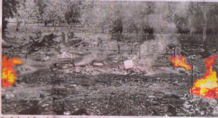
तेज बारिश के चलते मुक्तिधाम में खुले में जल रही चिताएं भी बुझ गईं।

तेज हवा और बारिश के चलते मेडिकल कॉलेज के बाहर लगा टेंट उड़ने लगा तो लोगों ने उसे पकड़ लिया। इस बीच अचानक से तेज बारिश का दौर भी शुरू हो गया। मौसम में अचानक से बदलाव को देखते हुए पुलिस और प्रशासन ने तत्काल मोर्चा संचालन और मेडिकल कॉलेज के बाहर टेंट में ठहरे लोगों को सुरक्षित स्थान पर ले जाने के लिए तैयारी शुरू कर दी। शहर के चौराहों पर खड़ी पुलिस बलों को मेडिकल कॉलेज लाया गया और यहां बाहर ठहरे मरीज के परिजनों