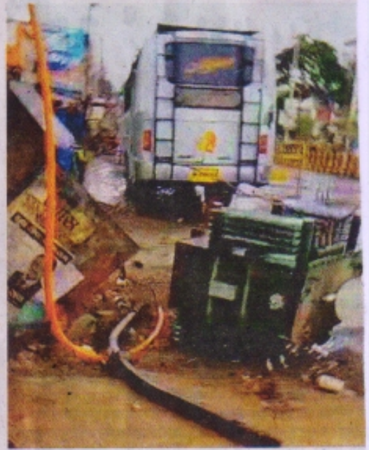
आंधी से क्षतिग्रस्त होकर गिरा ट्रांसफार्मर।