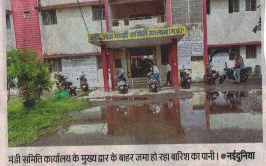
मंडी समिति कार्यालय के मुख्य द्वार के बाहर जमा हो रहा बारिश का पानी। ● नईदुनिया

रतलाम (नईदुनिया प्रतिनिधि)। कोरोना की तीसरी लहर के डर के बीच जिलों में डेंगू के मरीजों की संख्या तेजी से बढ़ रही है। गुरुवार को भी एलाइजा टेस्ट की बीस रिपोर्ट में चार नए मरीज मिलने के बाद जिले में अब डेंगू के 309 मरीज मिल चुके हैं। जिला अस्पताल, मेडिकल कालेज और निजी अस्पतालों में लगातार मरीज बढ़ रहे हैं।