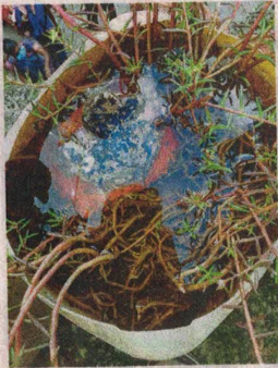
सेमलिया में सर्वे के दौरान गमले में लार्वा पाया गया। ● नईदुनिया