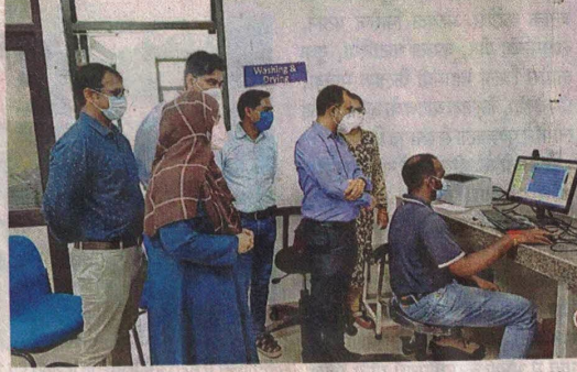
एलाइजा मशीन का इंस्टालेशन के बाद डाक्टर व टेक्नीशियन को प्रशिक्षण देते हुए सर्विस इंजीनियर। ● नईदुनिया