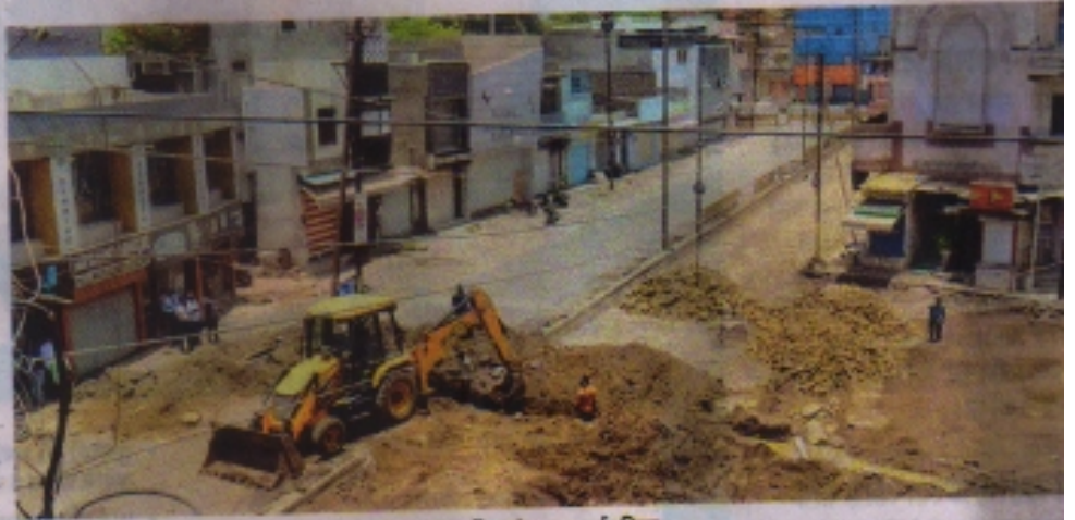
दो बत्ती क्षेत्र में सड़क के दोनों ओर खोदाई से आवागमन बाधित होगा।

दो बत्ती चौराहे पर भी पाइप-लाइन डालने के लिए खोदाई की गई है जबकि महाराजा सख्तसिंह प्रतिमा तक एक हिस्से में निर्माण होने से आवागमन बंद रहेगा। इससे वाहन चालकों को परेशानी होगी। निगम अधिकारी व ठेकेदार काम तेजी से पूरा करने का वादा कर रहे हैं। सात दिन में काम पूरा करने के निर्देश सोमवार दोपहर फोरलेन निर्माण कार्य का निरीक्षण निगम आयुक्त