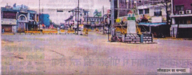
लॉकडाउन का सन्नाटा

रतलाम, कोरोना कर्फ्यू के चलते बीते 53 दिनों से लॉक रतलाम में आज से आमजन को छूट मिलेगी। गुरुआती दौर में बाजार सुबह 7 से शाम 5 बजे तक ही खुलेगा लेकिन उसमें भी बुनियादी दुकानों को ही छूट