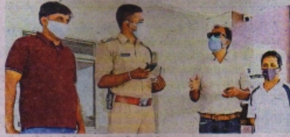
बाजार खोलने को लेकर चर्चा करते व्यापारी।