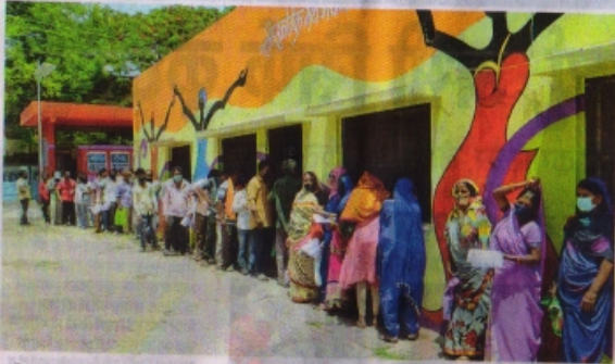
कानिका मठा नंव के पीछे जॉन कार्यालय पर लगी फल-सब्जी विक्रेताओं की भीड़।

राजमा शहर में साप्ताहिक संक्रमण दर पांच प्रतिशत से ज्यादा है। इसके चलते प्रतिबंधित गतिविधियों के अतिरिक्त 25 प्रतिशत दुकानें प्रातः 7:00 से शाम 5:00 बजे तक खुल सकेंगी। 25 प्रतिशत दुकानें कोन-सी होगी, इसका निर्धारण एसडीएम, सीएसपी, डीएसपी, स्थानीय व्यापारी