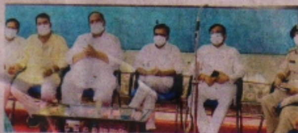
राजकीय मेडिकल कालेज में मंचासीन अतिथि।