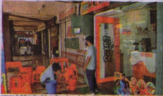
जबलपुर के शिवािक सेंटर में रस्त्रों की सफाई शुरू हो गई। वहां में 50% स्लैबों को बैठकर खाने की सट है।

राजधानी भोपाल समेत पूरा प्रदेश मंगलवार से अनलॉक होने जा रहा है। जहां संक्रमण की दर 5 फीसदी से अधिक है, वहां अधिक पाबंदी रहेगी, जबकि इससे कम दर वाले जिलों में सट अधिक होगी। सोमवार को गृह विभाग से जारी हुई गाइडलाइन के मुताबिक ज्यादातर गतिविधियों को चालू कर दिया गया है। कपड़ा, सराफा, फुटवेयर, बर्तन धोना, टेलरिंग मटेरियल जैसी दुकानें सोमवार, बुधवार और शुक्रवार को खुलेंगी। स्टेजरी, सेलून सोमवार, बुधवार और शुक्रवार को खुलेंगी। मंगलवार, गुरुवार और शुक्रवार को सभी भवन निर्माण सामग्री, ऑटोमोबाइल गैरान, घड़ी, चरमा जैसी दुकानें खोलने का निर्णय लिया गया है। सभी दुकानें सुबह 10 बजे से शाम 6 बजे तक खुल सकेंगी। हालांकि किराना, दवा, फल-फूल जैसी सेवास्य पंचों दिन मिलेंगी। प्रदेश में रविवार को कर्फ्यू रहेगा।