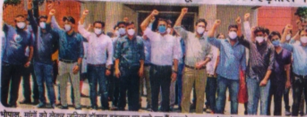
भोपाल, मांगों को लेकर जूनियर डॉक्टर हड़ताल पर चले गए हैं। इससे स्वास्थ्य सेवाओं पर असर पड़ेगा।