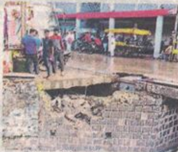
बस स्टैंड पर नाले के समीप सड़क के नीचे की मिट्टी घसने के बाद बने हालात।