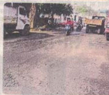
दोबत्ती चौराहे से स्टेशन की तरफ जाने वाले फ्रीमंज मार्ग के हाल भी जर्जर।