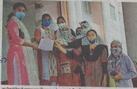
कलेक्टर के नाम एएनएम ने नायब तहसीलदार को ज्ञापन देती हुई एएनएम

कलेक्टर के नाम एएनएम ने नायब तहसीलदार को ज्ञापन सौंपा