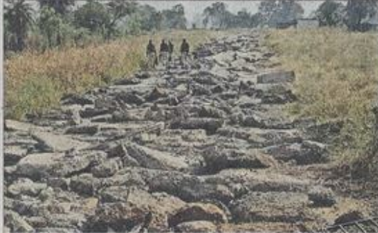
धोलाखड़ रोड की उखड़ी अवैध कॉलोनी की सड़क। (फाहल फोटो)

अवैध कॉलोनियों में बनाई सीसी रोड, बाउंड्रीवाल और बिजली पोल को किया जा चुका जमींदोज