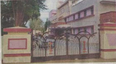
रतलाम नगर निगम भवन।