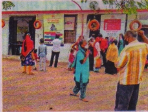
तहसील कार्यालय के केंद्र जहां गुरुवार को 28 के ही आवेदन लिए हैं।

स्कूलों में एडमिशन चल रहे हैं। ऐसे में बच्चों को आधार अपडेट कराना है लेकिन शहर के आधार केंद्रों के हल-बेहल हैं। हालत यह है कि कहीं वेटिंग चल रही है तो कहीं लिमिट में बन रहे हैं। नतीजतन अधिभावकों की परेशानी कम नहीं हो रही है और वे आधार अपडेशन के लिए एक केंद्र से दूसरे केंद्र भटक रहे हैं। बावजूद उनका आधार नहीं बन रहा है। गुरुवार को जो लोग भी आधार केंद्र पहुंचे उन्हें परेशान होना पड़ा और वही अपडेशन के घर लौटना पड़ा।