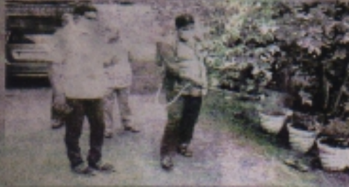
प्रताप न्यूज • रतलाम 2-7-21