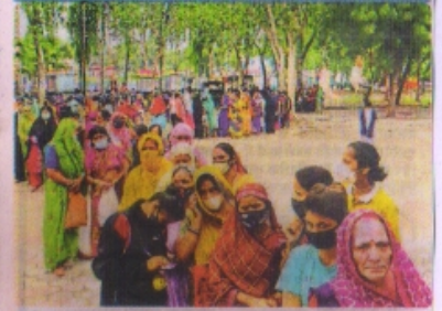
कालिका माता परिसर स्थित केंद्र पर लगी कतार।