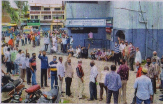
रतलाम के लोकेश्वर टाकीज परिसर में टीका लगवाने के लिए उमड़ी भीड़।

रतलाम (नईदुनिया प्रतिनिधि)। कोरोना वैक्सिनेशन महाअभियान में लोगों को टीका लगाने के लिए प्रेरित करने के बाद अब अब टीके का पढ़ने लगे हैं। गुरुवार को जिले में लगभग सभी केंद्रों पर तय लक्ष्य के मान से टीकाकरण योजना में ही पूरा हो गया। शहर में सभी 30 केंद्रों पर भीड़ लगी रही, कुछ जगह विवाद भी हुए। जिले में 37211 लोगों को गुरुवार को टीका लगाया गया। मान्य हो कि अब सरताह में दो बार टीकाकरण किए जाने की व्यवस्था की गई है। इसके पहले केंद्रों पर भीड़ बह रही है। गुरुवार सुबह करीब पांच बजे से ही कब्रिस्तान माता मंदिर, बोरिय स्कूल दोनों नगर सहित अन्य कुछ केंद्रों पर लोग खड़े हुए। टीआरएम आर्मिस्ट्रेंस केंद्र पर लंबी कतार में परेशान लोग व्यवस्था में सुधार की मांग करते रहे। अब अगला कैम्पेनियन बस ड्यूटी में ही होगा। 21 जन से अभी तक 126599 लोगों को टीका लगाया गया है। इसमें 97922 लोग 18 वर्ष से अधिक उम्र के हैं। कुल 28654 को उम्र 45 वर्ष से अधिक है। टीकाकरण अभियान में