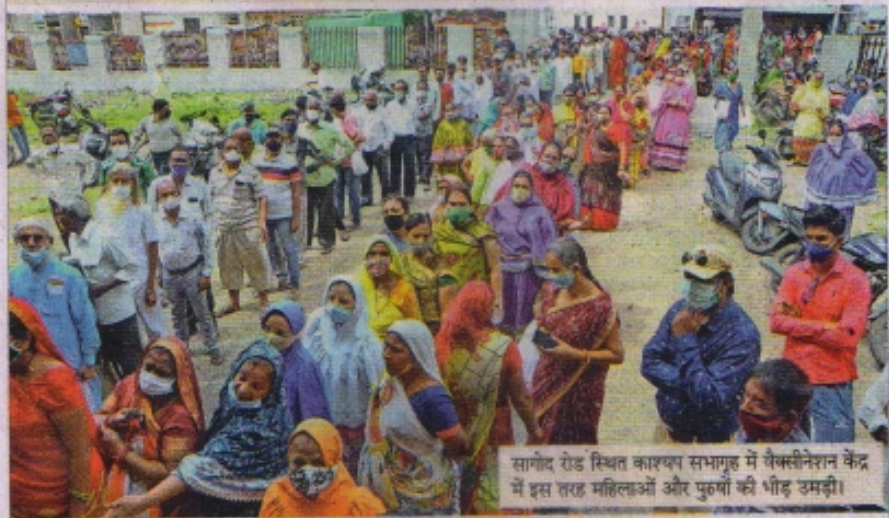
सांगोद रोड स्थित कारखाने सभागृह में वैक्सीनेशन केंद्र में इस तरह महिलाओं और पुरुषों की भीड़ उमड़ी।