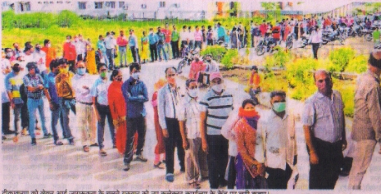
टीकाकरण को लेकर आई जागरूकता के चलते गुरुवार को नए कलेक्टर कार्यालय के केंद्र पर लगी कतार।

टीकाकरण के लिए शहर के पुराने कलेक्टर कार्यालय स्थित केंद्र को सिर्फ बुद्धजन और दिव्यांगों के लिए आरक्षित किया गया था लेकिन यहाँ भी सामान्य लोगों की बड़ी संख्या में भीड़ नजर आई जिसके चलते जिन लोगों के लिए यह केंद्र बनाया गया था उन्हीं में से कुछ लोग टीका लगवाने से वंचित रह गए। यहाँ पर धक्का-मुक्की और हंगामे की स्थिति बन गई थी जिसकी सूचना पर शहर एसडीएम अभियेक गहलोत मौके पर पहुंचे और हालात को संभाला।