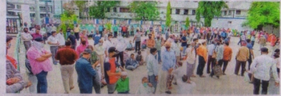
रतलाम के रेलवे आफिसर्स क्लब में टीका लगवाने के लिए उमड़ी भीड़।