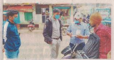
मास्क नहीं पहनने पर जुर्माना वसूलते हुए निगमकर्मियों। ● नईदुनिया

बैठक के बाद कलेक्टर व एसपी ने शहर में भ्रमण किया। अधिकारियों ने सभी से मास्क पहनने और वैक्सीन के