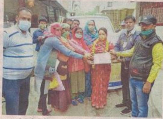
स्वच्छता में सहयोग के लिए रहवासी का सम्मान करते हुए निगमकर्मि। • नईदुनिया

अभियान के तहत दो दिसंबर को घरों से कचरा संग्रहण के दौरान सभी नागरिकों का उनके निरंतर सहयोग के लिए धन्यवाद ज्ञापन, यहर में स्वच्छता एप का प्रचार-प्रसार और स्वच्छता एप के माध्यम से शिकायत समाधान किया जाएगा। तीन व चार दिसंबर को सार्वजनिक क्षेत्रों में सफाई रखने के लिए नागरिकों, व्यापारिक संस्थानों, छोटी-बड़ी सभी दुकानों आदि में नगर निगम व एनजीओ की टीम के माध्यम से व्यक्तिगत संपर्क, धन्यवाद ज्ञापन,