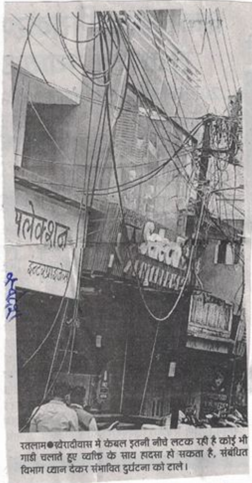
रतलाम ● खीरादीवास में केबल इतनी नीचे लटक रही है कोई भी गाड़ी चलाते हुए व्यक्ति के साथ हादसा हो सकता है, संबंधित विभाग ध्यान देकर संभावित दुर्घटना को टाले।