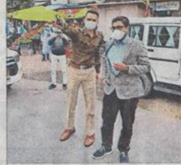
5 दिन में जिले में सिर्फ 1.06% बढ़ा वैक्सीनेशन

इधर... बाजार में निकले कलेक्टर-एसपी, धानमंडी में चाय की दुकान बंद करवाई