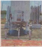
शासकीय मेडिकल कालेज में स्थापित आक्सीजन प्लांट। ● नईदुनिया

कलेक्टर ने जारी किए प्रतिबंधात्मक आदेश रतलाम। जिले में मास्क लगाना को अनिवार्य करते हुए कलेक्टर ने प्रतिक्रियात्मक आदेश जारी किए हैं। सभी नागरिकों, अधिकारी, कर्मचारियों को मास्क लगाना अनिवार्य होगा। ऐसा न करने पर 100 रुपये का जुर्माना किया जाएगा। दुकानदारों एवं दुकान पर कार्य करने वाले कर्मचारियों या ग्राहक