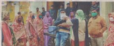
आव्या में घर-घर जाकर टीकाकरण करते हुए स्वास्थ्यकर्मियों। ● नईदुनिया

में से कोई भी मास्क के बगैर पाया जाता है तो 100 से 250 रुपये तक जुर्माना किया जाएगा। एक ही दुकान पर तीन बार उल्लंघन होने पर दुकान 24 घंटे के लिए बंद करा दी जाएगी। नगर निगम, एसडीएम की टीम इस पर कार्रवाई करेगी। आदेश के उल्लंघन पर धारा 188 तथा आपरा प्रबंधन अधिनियम में कार्रवाई होगी।