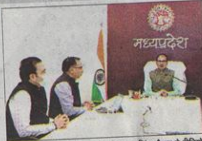
बुधवार को भोपाल में मुख्यमंत्री शिवराज सिंह चौहान ने वीडियो कॉन्फ्रेंसिंग के माध्यम से कोविड-19 के संबंध में जिला स्तरीय, विकासखंड स्तरीय, वार्ड स्तरीय तथा ग्राम स्तरीय क्राइसिस मैनेजमेंट समितियों के सदस्यों को संबोधित किया।