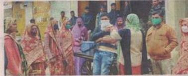
आम्बा में घर-घर जाकर टीकाकरण करते हुए स्वास्थ्यकर्मी।