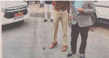
सेलान बस स्टैंड चौराहा पर निरीक्षण करते हुए कलेक्टर व एसपी। ● नईदुनिया

नामली में टीका नहीं लगाने पर दुकान सील नामली। कोविड की तीसरी लहर को लेकर जिला प्रशासन के निर्देश पर स्थानीय प्रशासन अलर्ट हो गया है। बुधवार को स्थानीय प्रशासनिक अधिकारियों के दल ने नगर के बाजार में भ्रमण कर दुकानदारों सहित आमजनों को कोविड के नियमों का पालन कर मास्क का उपयोग व टीकाकरण के लिए जागरूक किया। साथ ही दुकानदारों को हिदायत दी कि कोविड के दोनों डोज होना अनिवार्य है। दोनों डोज नहीं होने पर कार्रवाई की जाएगी। घुरने बस स्टैंड