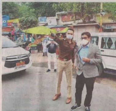
सैलाना बस स्टैंड वीरहा पर निरीक्षण करते हुए कलेक्टर व एसपी। ● नईदुनिया