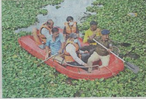
नाव में बैठकर तालाब की गहराई नापती इंदौर की टीम।

और आसपास की लोकेशन का सर्वे कर चुके हैं। झील संरक्षण योजना में 0.18 वर्ग किमी में फैले तालाब का सौंदर्यीकरण कर पिक्निक स्पॉट के रूप में विकसित किया जाना है। इसके लिए तालाब में मिलने वाले गंदे पानी के लिए तीन नालों में से बोहरा बाखल और लक्कड़पीठा वाले नाले पर वेटलैंड बनाया जाएगा। इसमें से गुजरने से पानी साफ होकर तालाब तक पहुंचेगा। वहीं, एक त्रिपोलिया गेट वाले को डायवर्ट कर त्रिवेणी मुक्तिधाम वाले नाले में मिलाया जाएगा। साथ ही पाल को चौड़ाकर पाथ-वे, मनोरंजन के लिए प्ले एरिया, बैठने के लिए गजबो, पार्किंग एरिया सहित अन्य सुविधाएं जुटाई जाएगी। इस पर 22.84 करोड़ रुपए खर्च होंगे। इसमें से केंद्र सरकार ने पहली किस्त में 6.85 करोड़ रुपए का अनुदान राज्य सरकार को दे दिया है। 4 करोड़ रुपए 4 फरवरी को दौर पर आए मुख्यमंत्री शिवराज सिंह चौहान प्रशासन को सौंप चुके हैं।