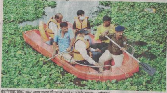
बोट में सवार होकर अमृत सागर तालाब की गहराई नापते हुए दल के सदस्य।

झील संरक्षण योजना में 22.84 करोड़ रुपये की स्वीकृति मिली है। इसमें एक्सेटिक बीड हार्बेस्टर मशीन से तालाब की सफाई की जाएगी। तालाब की गाद निकालने के लिए भी इंजर मशीन का उपयोग होगा। इसका टैंडर हो गया है। पहले इस योजना की लागत करीब 40 करोड़ आंकी गई थी। 0.18 वर्ग किलोमीटर में फैले तालाब में बोहरा बाखल तथा लक्कड़पीटा नाले का दूषित पानी मिलता है। गत एक-दो दशक से जलकुंभी की समस्या है। नीमच। जन अभियान परिषद के स्वयंसेवकों ने ग्राम जाट में मप जन अभियान परिषद के जिला समन्वयक वीरेंद्र सिंह ठाकुर के मार्गदर्शन में बोरी बंधान किया।