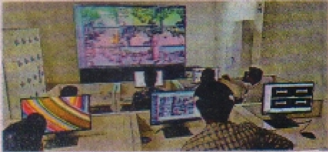
कंट्रोल रूम में सीसीटीवी कैमरों से निगरानी करते हुए।