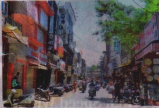
रतलाम के न्यू क्लॉथ मार्केट में खुली राइट साइड की दुकानें।

रतलाम (नईदुनिया प्रतिनिधि)। शहर में बाजार राइट व लेफ्ट की तरफ पर खोले जाने की व्यवस्था में गुरुवार को सड़क के राइट वाले हिस्से में दुकानें खोली गईं। बुधवार रात जारी आदेश के बाद राइट-लेफ्ट निर्धारण को लेकर इंटरनेट मीडिया पर चर्चा शुरू हो गई थी, रात में ही निगम अमले से सड़कों पर राइट व लेफ्ट के लिए चिह्न बनाए गए। सुबह कई जगह दुकानें खोलने को लेकर असमंजस भी रहा। अनलाक गाइडलाइन पालन कराने के लिए तैनात प्रशासन के दल ने मौके पर पहुंचकर स्थिति स्पष्ट की तो कई जगह लेफ्ट वाले हिस्से में भी दुकानें खुली रही। शुक्रवार को लेफ्ट साइड की दुकानें खोली जाएंगी जबकि शनिवार व रविवार को दुकानें बंद रहेंगी। मालूम हो कि एक जूस से अनलाक के बाद फिराना, दवा, वाइन, आटा चक्की दुकानें खोलने की अनुमति दी गई थी। शेष दुकानों को लेकर गुरुवार से ही गाइडलाइन तय की गई। हालांकि व्यापारी इससे भी संतुष्ट नहीं हैं। बाजार में भी गुरुवार को भीड़ रही, लेकिन