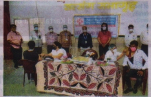
रतलाम के कालिका माता ससंग हाल में बैंककर्मियों व अधिकारियों टीका लगाती हुई स्वास्थ्यकर्मी।