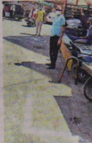
राइट और लेफ्ट के एक साथ निशान।

धानमंडी स्थित हनुमान मंदिर के सामने वाली पट्टी में राइट और लेफ्ट के निशान एक साथ लगा दिए। गुरुवार सुबह जब व्यापारी दुकानें खोलने पहुंचे तो एक साथ निशान देखकर कंप्यूज हो गए और दुकानों के बाहर ही खड़े हो गए। इसके बाद माणकचौक धाना टीआई के साथ टीम पहुंची तो व्यापारियों ने उन्हें अपनी समस्या बताई। इस पर टीम ने कहा कि आज राइट मान कर दुकान खोल लो, कल मत खोलना। कुछ इसी तरह की स्थिति व्यास दाल बाटी की लाइन की रखी। इस पट्टी के दुकानदारी ने दुकानें खोल ली तो पुलिस बंद कराने पहुंच गईं। इसके बाद टीआई पहुंचे और बोले आर का निशान लगा है। इससे दुकान खोल लो। समझाइश देना चाहिए और फिर चालान बनाना चाहिए - शाम पौने पांच बजते ही पुलिस व्यापारियों की दुकानों पर पहुंच उनसे कहती है कि पांच बजने वाली है दुकानें बंद करना शुरू कर दो। वही पांच बजे के बाद पांच मिनट तक भी किसी की दुकान खुली रह