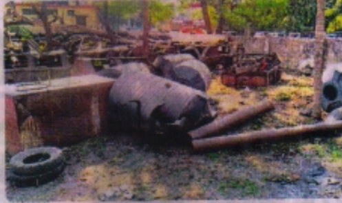
निगम में कबाड़ में बदल गईं पेयजल टंकियां।

नगर निगम के बिली परिषद के दौरान 49 वार्डों में पेयजल समस्या के समाधान के लिए सिंथेटिक की