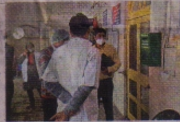
टीम ने शिकायत पेटी को देखकर पूछ ही लिया... इसे कब खोलते हो, शिकायत मिलती है या नहीं।

वार्ड : वार्ड साफ सुधरे थे, तारीफ हुई है। स्टाफ : नर्सिंग स्टाफ ने 70 प्रतिशत से ज्यादा सवाल्यों के जवाब दे दिए हैं। नई लैब : अस्पताल की नई लैब को दिखाया। एमसीएच : एसएनसीयू को व्यवस्था बेहतर मिली।