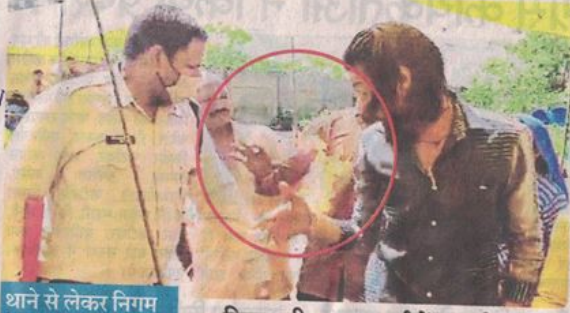
थाने से लेकर निगम तक पहुंचें