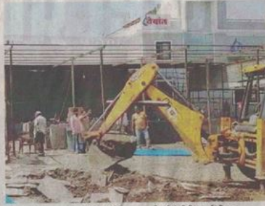
सेलाना रोड पर शासकीय भूमि से अतिक्रमण हटाती हुई जेसीबी।