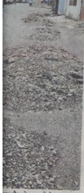
लेकिन निर्माण नहीं किया

ख जैन ने यह फोटो उपलब्ध निगम द्वारा सीवरेंज लाइन लेकिन अब ना तो सड़क की मांग किया जा रहा है। अब म अब तो मरम्मत की जाए।