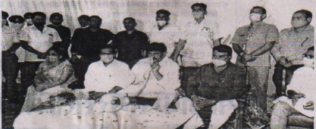
प्रताप न्यूज • सलाम