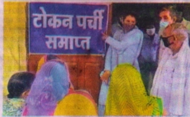
वैक्सीन सेंटरों पर इस तरह बोर्ड लगाकर बताया टोकन पर्ची खत्म हुई।

जिले में जिस रफ्तार से पहला डोज लग रहा है, उसी रफ्तार से दूसरा डोज लगना जरूरी है। हालांकि अभी 84 दिन पहले जिन लोगों को वैक्सीन का पहला डोज लगा था उनके ही दूसरे डोज में परेशानी हो रही है। सोमवार को जिले में 31,012 लोगों को कोविशील्ड का दूसरा डोज लगना था लेकिन कम वैक्सीन ने ज्यादा लोगों को परेशान कर दिया। ऐसा इसलिए क्योंकि जिले में 12,323 लोगों को ही टीके लग सके। वार्ड 11 व 12 के लोगों के लिए बने केंद्र में 8.15 बजे ही टोकन समाप्त हो गए, अन्य केंद्रों पर भी ऐसी ही स्थिति बनी। कई केंद्रों पर विवाद की नौबत भी बनी।