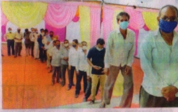
बिलापाक में कोविशील्ड के दूसरे डोज के लिए लाइन में खड़े ग्रामीण।

इस दौरान अल्लोट बिक्रमसिंह में 1094, बाजना में 524, सैलाना में 503, जावरा में 2120, पिपलीदा में 1042, रतलाम ग्रामीण में 1081,