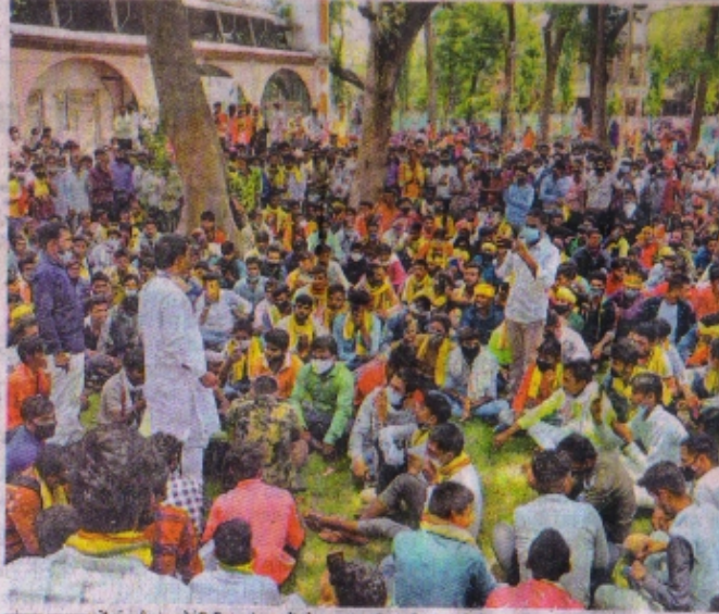
गुलाब चक्कर में प्रदर्शन करते विभिन्न पंचायतों से आए आदिवासी संगठनों के पदाधिकारी।

आदिवासी नेता-बोले निवेश क्षेत्र स्वीकार्य नहीं, प्रशासन को खुली चेतावनी दी