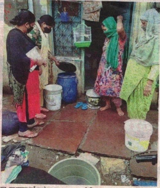
घर-घर जाकर सर्वे करते हुए दल सदस्य।