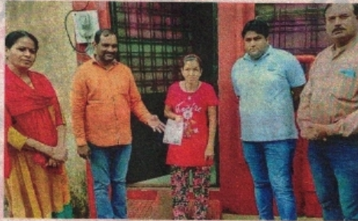
अन्न उत्सव में शामिल होने का आमंत्रण देते हुईं भाजपाईं।