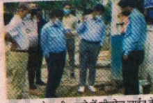
मुक्तिघाम के समीप नाले में सीवरेज लाईन के छोड़े गये पाईप से आ रहे पानी के बहाव को