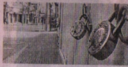
दैनिक आपत्तिका >> भोपाल

राज्य सरकार ने मध्यप्रदेश के सभी शहरों में संडे लॉकडाउन का ऐलान कर दिया है। सभी सरकारी दफ्तर अगले 3 महीने तक समाह में केवल 5 दिन ही खुलेंगे। इनको टार्गटिंग सुबह 10 से शाम 6 बजे तक रहेगी। रविवार और रविवार दफ्तर पूरी तरह बंद रहेंगे।