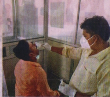
फ्लैवर क्लीनिक में लगातार सैपलिंग बढ़ रही है।

माइल्ड टू मॉडरेट मरीजों को लगते हैं इंजेक्शन... सितंबर में स्टॉक हुआ था खत्म