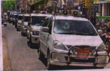
वाहनों से शहर में पलैंग मार्च करता प्रशासनिक अमला।

विछरवा दो दिनों लॉकडाउन बुधवार रात 10 बजे से शुरू होकर सोमवार सुबह 6 बजे तक 56 घंटे चला था। बुधवार तक भी लॉकडाउन को लेकर जानकारी सभ्य नहीं आने पर सोशल मीडिया में गुरुवार को अपराह्न 4 बजे से सोमवार सुबह 6 बजे तक लॉकडाउन की अफवाह