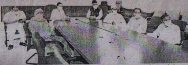
धर्मगुरुओं ने रतलाम के नागरिकों से अपील