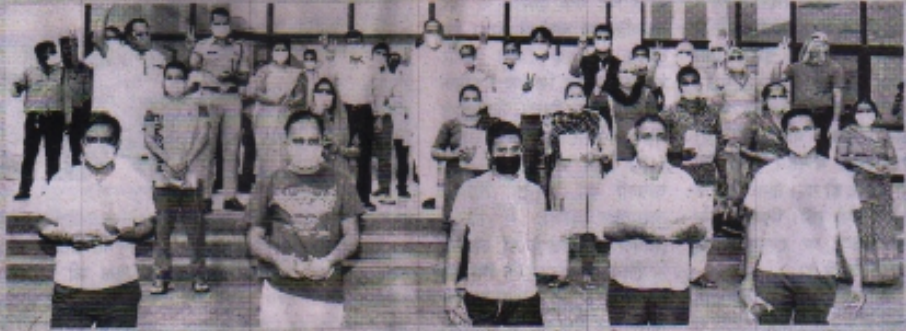
दबंग रिपोर्टर ■ रतलाम

मेडिकल कॉलेज से 11 कोरोना योद्धा स्वस्थ होकर लौटे