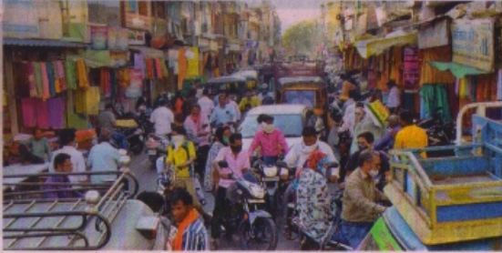
रतलाम के बाजार में अभी भी कई लोग बिना मास्क पहने घूम रहे हैं और शारीरिक दूरी का पालन भी नहीं कर रहे हैं।