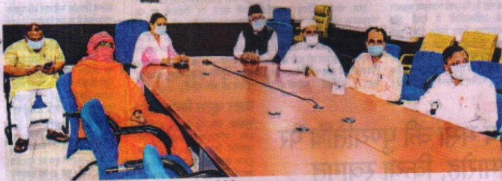
कोरोना से लड़ने के लिए कलेक्टर के एकत्र हुए सभी धर्मों के प्रतिनिधि।