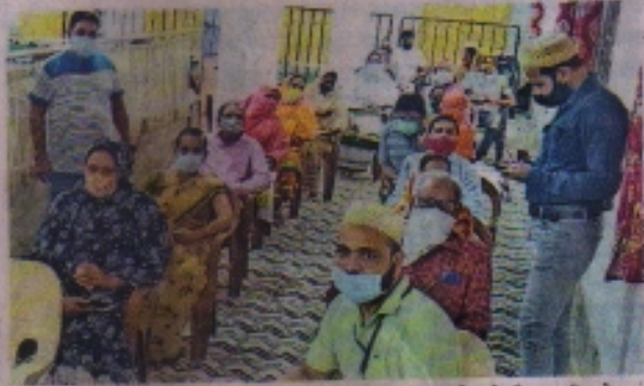
बोहरा बाखल में सोमवार को 45+ के साथ 18+ वरु के बिना रजिस्ट्रेशन के वैक्सीन लगाई। बुरहानी गाई और समाजजनों ने व्यवस्था संभाली।