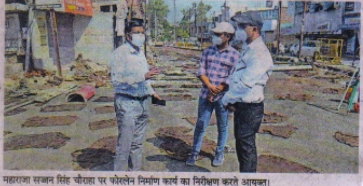
महाराजा सज्जन सिंह चौराहा पर फोरलेन निर्माण कार्य का निरीक्षण करते आयुक्त।