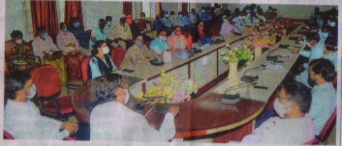
बैठक को संबोधित करते हुए नगर निगम आयुक्त सोमनाथ झारिया।

रतलाम। आयुष्मान भारत 'निर्धनयम' योजना अंतर्गत शहर के पात्र हितग्राहियों के निशुल्क आयुष्मान कार्ड बनाने का कार्य नगर निगम ने प्रारंभ कर दिया है। 15 जून तक कार्डों के कामन सर्विस सेंटरों पर निगम आयुक्त सोमनाथ झारिया के निर्देश में कार्ड बार निशुक्त