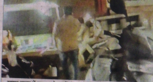
सराफा बाजार में रात 8 बजे दुकानें बंद कराते पीता फोर्स के जवान।

छोटे दुकानदार बोल रहे-हम मजबूरी में आधा माल बना रहे ताकि खराब होने की नौबत नहीं आए