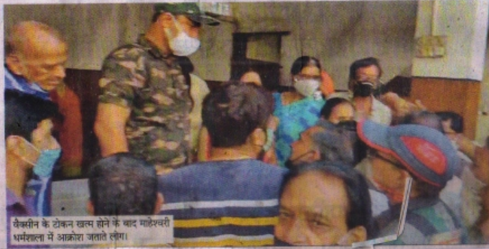
वैक्सीन के टोकन खत्म होने के बाद माधेश्वरी धर्मशाला में आक्रोश जताते लोग।

कोरोना डोज को वेस्टेज होने से बचना जा रहा है। 2300 लोगों के लिए ही टीके उपलब्ध थे लेकिन शाम तक 2474 का टीकाकरण हो गया। जो 107.57% है। इधर जिले में 21 जून से अब तक 145850 लोगों को टीका लगाया जा चुका है। जबकि लक्ष्य 1.50 लाख का बनाया गया है। लक्ष्य के मुकाबले अब तक 97.23% लोगों को वैक्सीन लग चुकी है।