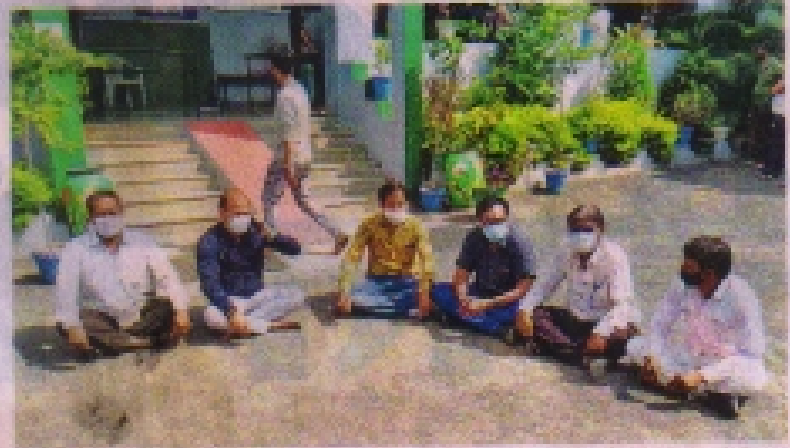
वैक्सिनेशन केंद्र के बाहर धरना देते हुए भाजपा कार्यकर्ता।