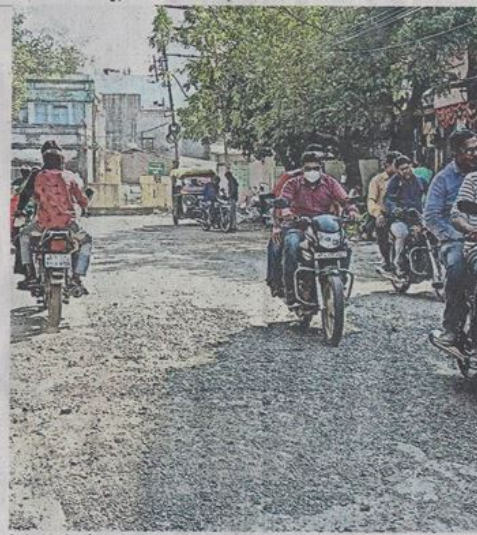
ये गोशाला रोड है, कहने को नगर निगम ने इस पर पेचवर्क कर दिया है। फिर भी सड़क मण्डवेदार हो रही है। पेचवर्क के लिए डाली गई गिट्टी भी उखड़ने लगी है।