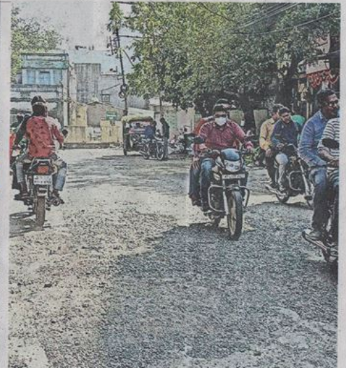
ये गोशाला रोड है, कानने को नगर निगम ने इस पर पेचवर्क कर दिया है। फिर भी सड़क गइंटेदर हो रही है। पेचवर्क के लिए ढाली गई गिट्टी भी उखड़ने लगी है।