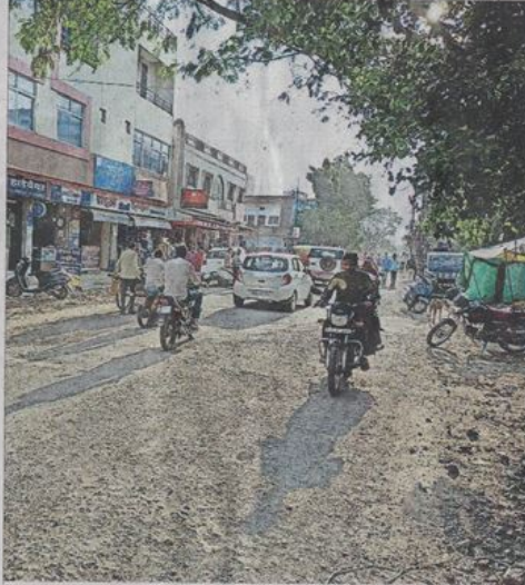
यह हालत है कन्पुरवा नगर मुख्य मार्ग की, इसकी स्वीचरेज और पानी की पाइप लाइन के लिए दो बार खुदाई हो चुकी है। रिस्टोरेशन दोनों ही बार नहीं हुआ।

रोडमैप के अनुसार सड़क बनने में लग जाएंगे दस साल - सड़कों को लेकर नगर निगम का यही स्वेचा रहा तो फरवरी में मुख्यमंत्री द्वारा स्वीकृत रोड नेटवर्क सुधारने के प्लान को अमली जामा पहनने में दस साल लग जाऐ। इसमें निगम ने 166.78 किमी लंबे रोड नेटवर्क को सुधारने