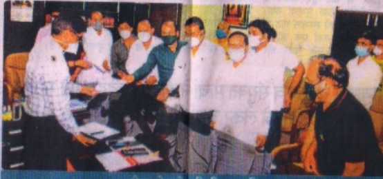
जेल भोजन की दी धमकी