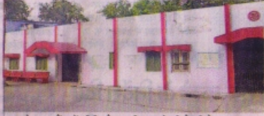
पुणे ब्लड बैंक में सीटी स्कैन मशीन लगाने की तैयारी है।

जिम्मेदारों का दावा : 10 से 15 दिन में शुरू हो जाएगी मशीन, दूसरी लहर में 15 हजार से ज्यादा लोगों को पड़ी जरूरत