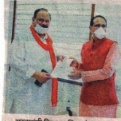
मुख्यमंत्री शिवराजसिंह चौहान को आमंत्रण पत्र भेंट करते हुए विधायक चेतन्य काश्यप।

रतलाम. विधायक चेतन्य काश्यप ने भोपाल में मुख्यमंत्री शिवराजसिंह चौहान से भेंट कर उन्हें रतलाम के मेडिकल कॉलेज में अस्पताल का उद्घाटन करने के लिए आमंत्रित किया। विधानसभा के मुख्यमंत्री कक्ष में चौहान को सौंपे आमंत्रण पत्र में काश्यप ने आग्रह किया कि आम जनता और भाजपा कार्यकर्ताओं की इच्छा है कि अस्पताल का उद्घाटन मुख्यमंत्री के हाथों हो। विधायक काश्यप ने बताया कि रतलाम के मेडिकल कॉलेज में अस्पताल बनकर तैयार हो गया है। स्टाफ की नियुक्तियां हो चुकी हैं। आवश्यक मशीनें और उपकरणों की आपूर्ति भी हो चुकी है।