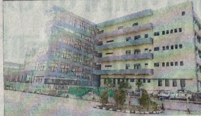
इस भवन में मेडिकल कॉलेज के अस्पताल की शुरुआत होना है।

अब एक्टिव केस केवल एक 750 बेड का मल्टी स्पेशियलिटी अस्पताल बनना है 550 बेड का अभी कोविड अस्पताल बना हुआ है 2 मरीज ही कोविड अस्पताल में भर्ती हैं 1 कोविड सिंग अलग हो जाएगी, अस्पताल की शुरुआत के बाद 10 से ज्यादा माइक्रो ओटी रहेंगी कॉलेज में 140 से ज्यादा डॉक्टर अपनी सेवाएं देते हैं 300 से ज्यादा स्टाफ नर्स कॉलेज में है