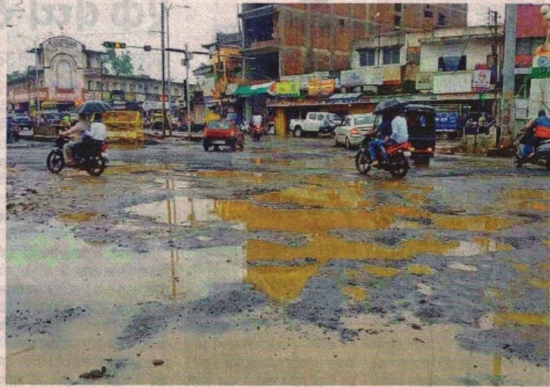
रतलाम के अतिव्यस्ततम दो बत्ती चौराहा की गड़बड़ेदार सड़क।

में पटवारी व अन्य द्वारा बाउंड्रीवाल तोड़ दी गई। यहां फोरलेन प्रस्तावित की गई जबकि मंदिर के आगे की भूमि पर टू-लेन है। इस प्रस्ताव को निरस्त किया जाना चाहिए।