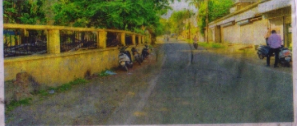
कान्वेंट तिराहा, जहां सिटी फोरलेन के लिए जमीन काम पड़ रही है।