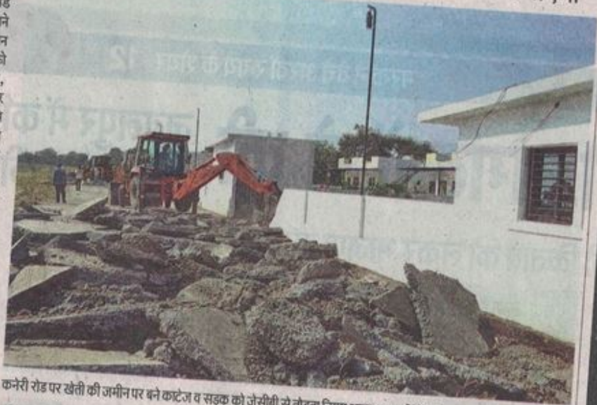
कनेरी रोड पर खेती की जमीन पर बने काटेज व सड़क को जेसीबी से तोड़ता निगम अमला।