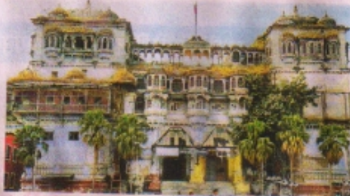
रतलाम का राजाजीत विलास पैलेस (राजमहल)।