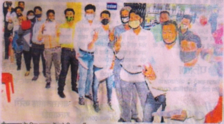
टीकाकरण के लिए कतार में खड़े निगमकर्मि।

यह पहला मौका है जब टीकाकरण को लेकर किसी विभाग के कर्मचारियों में इतना उत्साह नजर आया है जबकि इसके पूर्व से राजस्व, पुलिस और स्वास्थ्य विभाग के अस्पते को टीका लगाए जाने के