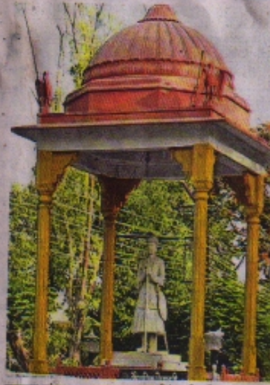
रतलाम संस्थापक महाराजा रतन सिंह की प्रतिमा।

17 फरवरी - दोपहर 2 बजे जेएमडी पैलेस में मेरा रतलाम प्रगति के पथ पर विषय पर संगोष्ठी।