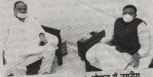
सिंधम रिपोर्टर □ रतलाम