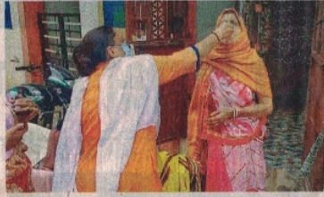
महिला को दवा खिलाती हुई स्वास्थ्य कार्यकर्ता। • नईदुनिया