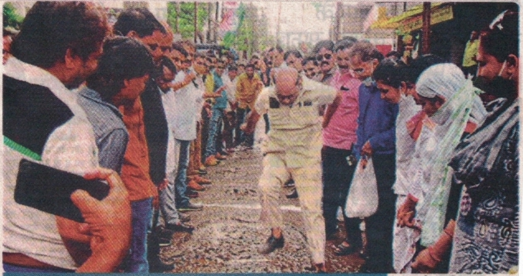
जगाने के लिए हुए आयोजन

शहर के दयनीय जर्जर व गड्ढों से भरी सड़कों पर ध्यान आकर्षित करने के लिए शहर कांग्रेस कमेटी द्वारा दो बत्ती चौराहे पर गड्ढा कूद प्रतियोगिता का अन्वृत्त आयोजन किया गया। दोपहर 12 बजे हुए आयोजन में एक घंटे तक कार्यकर्ताओं ने सहभागिता की। इस दौरान महिला कार्यकर्ताओं ने गड्ढों पर पौधारोपण भी आंदोलन अंतर्गत किया।