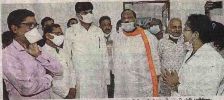
बाल चिकित्सालय के नए भवन के शुभारंभ अवसर पर व्यवस्थाओं के बारे में जानते प्रभारी मंत्री भदौरिया।

कलेक्टर कुमार पुरुषोत्तम की पहल पर बाल चिकित्सालय का भवन नए सिरे से तैयार किया गया है। पहले यहाँ 10 बेड थे, जो अब 65 हो गए हैं। इसी के साथ बाल चिकित्सालय में अन्य सुविधाओं को भी बढ़ाया गया है। प्रभारी मंत्री भदौरिया ने कहा पुराने समय में जनभागीदारी, जनसहयोग से बाल चिकित्सालय के निर्माण का अद्भुत काम रतलाम में हुआ था