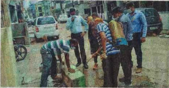
रतनाम में होज खाली कर दया का डिडकाव करते हुए कर्मचारी। ● नईदुनिया

इस जिले में दो दिन से एराइजा टेस्ट रिपोर्ट में डेंगू के नए मरीज नहीं मिले और रविवार को एंटीजन की सभी 12 रिपोर्ट में निगेटिव मिली। जिला अस्पताल का महिला-पुरुष मेडिकल वार्ड बुखार के मरीजों से भर गया है। डेंगू के उपचार के लिए मेडिकल कालेज में बनाए गए 60 बेड वार्ड में रविवार को मरीजों की संख्या 97 रही। यहां बुखार के मरीजों को भी भर्ती किया जा रहा है। इसके लिए बेड बहाए गए हैं। पिछले तीन दिन से मेडिकल कालेज में मरीजों की संख्या