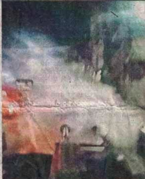
शहर में मच्छरों को भगाने के लिए लगातार फव्वारा की जा रही है।

इधर, जिला अस्पताल में मरीजों की भीड़ बनी हुई है। ओपीडी में 1800 से 2000 लोग पहुंच रहे हैं। 7 सितंबर को 2165 लोग पहुंचे तो वहीं, 11 सितंबर को 1860, 12 सितंबर को रविवार का अवकाश होने पर भी 888 लोग रजिस्टर्ड हुए हैं। डॉक्टरों के मुताबिक मरीजों में बुखार, सर्दी-खांसी, बदन दर्द के मरीज ज्यादा आ रहे हैं। इनमें ज्यादातर सीजनल हैं। अगस्त में 43667 लोग रजिस्टर्ड हुए थे। इधर, मानव सेवा समिति ब्लड बैंक से 10 दिन में 137 गंभीर लोगों को प्लेटलेट्स दे चुके हैं, इसकी सूची प्रशासन को दी है। अब इनके घरों के आसपास एंटी लावा एक्टिविटी होगी।