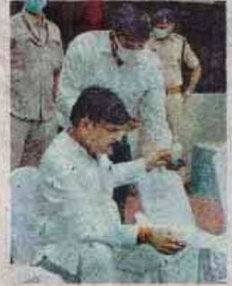
तबीयत खराब होने के बाद प्रभारी मंत्री को बाल चिकित्सालय में भी दवा दी गई।