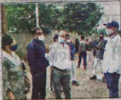
कलेक्टर ने मदारपुरा क्षेत्र का निरीक्षण कर अधिकारियों को दिशे निर्देश।