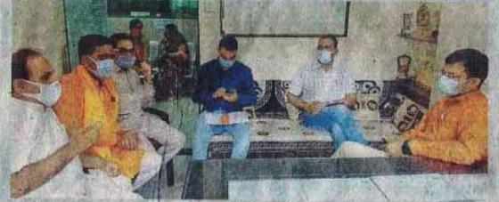
जिला प्रशासन की टीम को सूची सौंपने के साथ जानकारी देते हुए समिति के प्राधिकारी।