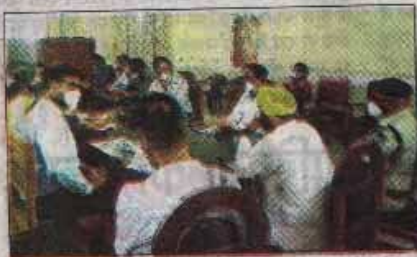
मंत्री डंग ने बैठक में अधिकारियों को डेंगू पर नियंत्रण के दिशे निर्देश।

मन्दसौर (आरएनएन)। जिले भर में नजरीय सर्वे में करीब दो हजार से अधिक लोग डेंगू से पीड़ित हो चुके हैं। केवल सरकारी आंकड़ा ही 825 मरीजों का हो चुका है।