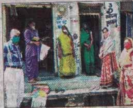
मलेरिया विभाग की टीम घर-घर जाकर कर रही है सर्वे।