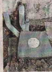
दोनस्थाल नगर में इस तरह किए जा रहे हैं हाउस कनेक्शन।