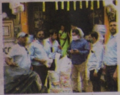
500 रुपये का जुर्माना कर भविष्य में खुले में कचरा ना डालने की समझाईय दी।

रतलाम। शासन निर्देशानुसार नगरीय क्षेत्र रतलाम में 50 माईक्रॉन से कम मोटाई की पॉलीथीन व प्लास्टिक उपयोग प्रतिबंधित किये जाने के तहत कलेक्टर एवं प्रशासक नगर पालिक निगम रतलाम गोपालचन्द्र डांड व निगम आयुक्त सोमनाथ झारिया के निर्देशानुसार जुमाने की कार्यवाही की जा रही है। धानमण्डी क्षेत्र में श्रीजी डिस्पोजल से 242 किलो व बालाजी डिस्पोजल से 132 किलो 50 माईक्रॉन से कम मोटाई की पॉलीथीन निगम आयुक्त के निर्देशानुसार स्पाईट फाईन द्वारा जब्त की जाकर संबंधितों पर 5000 व 3000 का जुर्माना किया। इसके अलावा काटजू नगर क्षेत्र में अयोक्त माहेश्वरी द्वारा खुले में कचरा जाता है इसका विडियो निगम को प्राप्त होने पर स्पाईट फाईन दल द्वारा विडियो के आधार पर संबंधित के घर जाकर