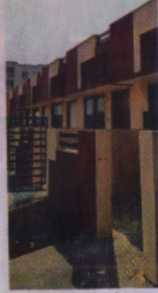
परशुराम विहार कॉलोनी में बनकर तैयार मकान, जिनकी रजिस्ट्री नहीं करवा रहा विकास प्राधिकरण।

था लेकिन कुछ खासियों और लाइट फिटिंग, सैनेटरी वर्क सहित कुछ छोटे काम अट्टरे मिले थे। अब निर्माण के दौरान चेकिंग करने के बजाय ऑफिस में बैठकर बिल पास करने वाले इंजीनियर ठेकेदार पर काम पूरा करने दबाव बना रहे हैं। उपर राजनीतिक पकड़ की बदीलत 1.90 करोड़ में से 1.80 करोड़ रुपए ले चुका ठेकेदार भी काम शुरू करने को तैयार नहीं है। अफसर व ठेकेदार को सड़ई में बैंक से लोन लेकर रुपए भरने वाले परिवार मिसा रहे हैं। कई बार रजिस्ट्री करने का आवेदन देने के खबजुद अफसर लगातार टालमटोल कर रहे हैं।