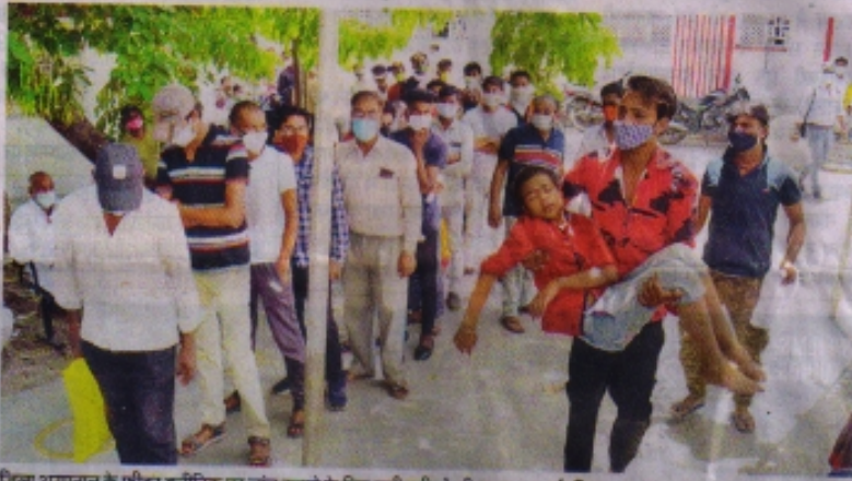
जिला अस्पताल के फीवर क्लीनिक पर जांच कराने के लिए लगी मरीजों की कतार।