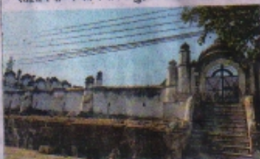
शहर की सबसे प्राचीन लाकड़पौड़ा स्थित ईदगाह।

रतलाम राज्य की स्थापना हुई थी तब राजा रतनसिंह जी के साथ कुछ