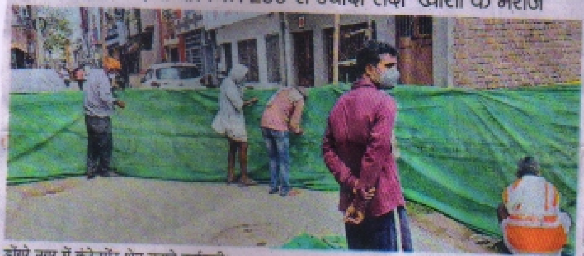
डोंगरे नगर में कंटेनमेंट क्षेत्र बनाते कर्मचारी।

घर-घर सर्वे में दलों को मिले 230 से ज्यादा सर्दी-खांसी के मरीज