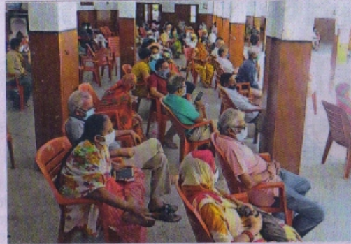
माहेश्वरी धर्मशाला के केंद्र पर ऐसी भीड़ रही और डिस्टेंसिंग का नागोनिशन नहीं दिखा।