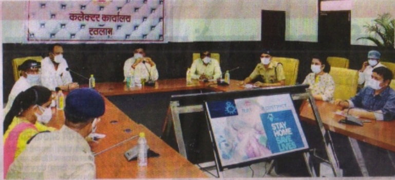
कलेक्टर रत्नलाम ने बैठक को संबोधित करते हुए उच्च शिक्षा मंत्री डा. मोहन यादव।

रत्नलाम (नईदुनिया प्रतिनिधि)। शहर के साथ ग्रामीण क्षेत्रों में कोरोना संक्रमण के मामले तेजी से बढ़ने के चलते अब गांवों में भी उपचार के इंतजाम बढ़ाए जा रहे हैं। गुरुवार को वित्त मंत्री अशोक देवड़ा के स्थान पर उच्च शिक्षा मंत्री मोहन यादव को जिला कोविड प्रभारी मंत्री नियुक्त किया। नियुक्ति के बाद ये रत्नलाम पहुंचे और बैठक लेकर कोरोना निबंधन के लिए किए गए इंतजामों की समीक्षा की। जिले में संक्रमण की दर 26 प्रतिशत तक पहुंचने के चलते कोरोना कर्फ्यू 25 मई की सुबह छह बजे तक बढ़ाने का निर्णय किया गया। बैठक में मंत्री यादव ने निर्देश दिए कि ग्रामीण क्षेत्रों में प्रमुख शमकीय अस्पतालों में भी आक्सीजन बेड पर्याप्त संख्या में उपलब्ध कराए जाएं, आवश्यकता पड़ने पर छोटे कोविड केयर सेंटर की भी वृद्धि की जाएगी। साथ ही पब्लिक मेडिकल स्टाफ रखा जाएगा। मेडिकल कॉलेज में अपने वाला हर मरीज उपचार प्राप्त करें, निराश वापस नहीं लौटें। मेडिकल कॉलेज में 150 से 200