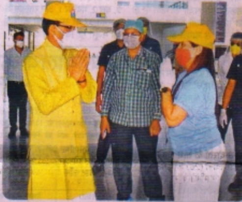
मुख्यमंत्री शिवराज सिंह चौहान ने रीवा में कोरोना वॉलंटियर अभियान और जन अभियान परिषद् से जुड़े कार्यकर्ताओं से मुलाकात की।

भोपाल. शिवराज सरकार ने गुरुवार को कोरोना के कहर से बेसहारा हुए बच्चों के लिए बड़ा ऐलान किया। सीएम शिवराज सिंह चौहान ने कहा कि बेसहारा (अनाथ) हुए बच्चों को सरकार मुफ्त शिक्षा देगी। बच्चों सहित असहाय परिजन को राशन और इलाज के साथ 5000 रुपए महीने पेंशन भी दी जाएगी। यदि वे कोई काम-धंधा करना चाहेंगे तो सरकार की गारंटी पर उन्हें बिना ब्याज के कर्ज भी मिल सकेगा। इसके लिए योजना बनाकर जारी की जाएगी।