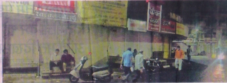
रतलाम के सरफत बाजार में रात 10-11 बजे तक रोक रखा करती थी, प्रशासन अभी 8 बजे ही बाजार बंद करवा रहा है।

नहीं आए हैं। आपको दुकानें बंद रखना पड़ेगी। सरफत बाजार के साथ ही नौलाहरा, माणकचौक, घास कजार, चैम्पुवापुल, गणेश देवरी, बजाज खाना, धानमंडी, शहर सराफ, न्यू क्लथ मार्केट, भूट्टा बाजार सहित अन्य बाजारों में खाने पीने की चलित दुकानें छोड़कर बाकी की सारी दुकानें रात 8 बजे बाद ही बंद करवा दी। कई दुकानों पर तो खरीददारी चल रही थी। इससे ग्राहकों को खाली हाथ लौटाना। इससे रात 8 बजे बाद पूरा बाजार ही बंद हो गया। सीएम के आदेश के बाद भी शहर में दुकानें बंद कराने से कारोबारियों में नाराजी है।