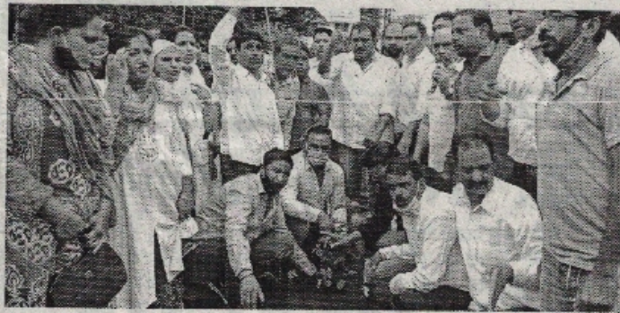
गड्डों में पौधे