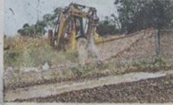
धोलावड़ रोड की अवैध कॉलोनी में बनाई जा रही बाउंड्रीवॉल तोड़ती जेसीबी।