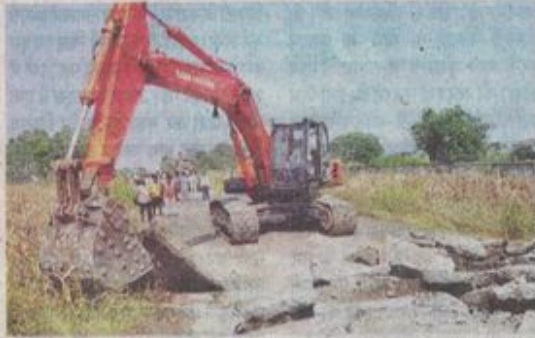
धोलावड़ रोड पर अवैध निर्माण तोड़ती हुई पोक्लेन।

शहर में रहवासी, व्यावसायिक क्षेत्रों में निगम से अनुमति लेने के बाद अनुमति