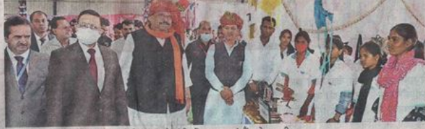
कार्यक्रम के दौरान लगी स्टाल का निरीक्षण करते मंत्री, विधायक एवं बैंक के एमडी।

वाला कदम था। जीरो बेलेंस पर खाते खोलने की योजना से हो गया है कि आम आदमी तक सरकार की मदद सीधे पहुंच रही है। विधायक चेतन्य काश्यप ने कहा क्रेडिट आउटरीच जैसे कार्यक्रम दरां रहे हैं कि शासन द्वारा आमजन की भलाई के लिए उनके बीच जाकर कार्य किया जा रहा है। स्टेटल बैंक ऑफ इंडिया के एमडी एम.वी. राव ने कहा भारत सरकार ने बैंकों के माध्यम से अर्थव्यवस्था को तेजी से आगे बढ़ाने के लिए कई विशेष कार्यक्रम शुरू किए हैं। कोरोना काल में ठप हुए रोजगार से निर्मित स्थिति में बैंकों द्वारा प्रस्त सेवाओं को सबसे महत्वपूर्ण घटक माना जा रहा है। एक कार्य योजना के तहत क्रेडिट आउटरीच जैसे कार्यक्रम प्रदेश के 52 जिलों तथा 313 ब्लॉक में आयोजित किए जा रहे हैं जिनके माध्यम से कोरोना के बाद की अर्थव्यवस्था को नई गति तथा पुनर्जीवन देना है। बैंककर्मियों ने सरकार की सहयता