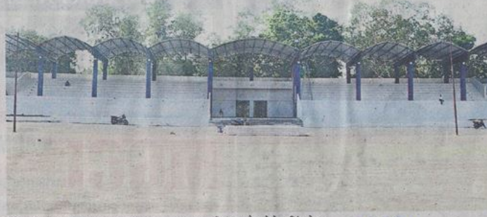
नेहरू स्टेडियम का स्वरूप अब कुछ इस तरह बदला हुआ दिख रहा है।

नेहरू स्टेडियम शहर का सबसे प्रमुख स्टेडियम है। काम में देरी से लगातार खिलाड़ियों में नाराजगी हो रही थी। हालांकि, इस स्टेडियम में बहुमंजिला स्पोर्ट्स कॉम्प्लेक्स की योजना थी, जिसमें 3.64 करोड़ के खर्च से जमीन तल के अलावा तीन मंजिला सभी खेलों की सुविधा वाला कॉम्प्लेक्स बनना था, लेकिन इस प्रोजेक्ट को बंद कर दिया गया। अब पैवेलियन में टीन रोड लगाकर नया स्वरूप दिया है। इससे स्टेडियम की खूबसूरती बढ़ी है।