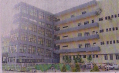
मेडिकल कॉलेज के अस्पताल की बिल्डिंग में कोविड अस्पताल बना हुआ है। हालांकि, अभी परिस्तर सुना है क्योंकि यहाँ अब 35 मरीज ही बचे हैं।

कॉलेज के अस्पताल के लिए सबसे बड़ी समस्या नर्सिंग स्टाफ की थी, जो अब दो महीने में मिल जाएगा। इसके लिए महिला स्टाफ नर्स की 390 पदों पर भर्ती हुई है। इसमें सीपी भी 309 और खैयदा से 81 नर्स शामिल हैं। मार्च से इसकी प्रक्रिया चल रही है, दो महीने में स्टाफ कॉलेज को मिल जाएगा। इसी के साथ कॉलेज में पैरामेडिकल स्टाफ की समस्या का भी समाधान हो जाएगा।