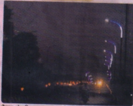
सैलाना ओवरक्रिज पर इस तरह आधी लाइटें बंद है।

रतलाम. शहर में 2018 में 13948 एलईडी लाइट शहर के पोल पर नगर निगम ने लगाई। नोएडा की जिस ऐजेंसी से इसको लगवाया था उसमें शर्त यह थी की सात साल तक निगम हर माह 10.43 लाख रुपए देकर रखरखाव करवाएगा। निगम अपने हिस्से के रुपए तो हर माह दे रहा है, लेकिन इन एलईडी को लगाने वाली ऐजेंसी रखरखाव करवाने में असफल रही। खासियाजा करीब 1348 एलईडी खराब होने पर उठा रहा है। हैरानी की बात की 1300 से अधिक एलईडी के सुधार के लिए कंपनी ने एक कर्मचारी रखा हुआ है।