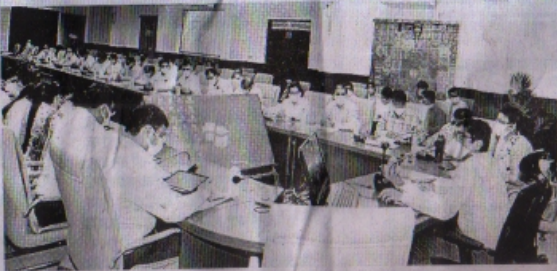
कर्मचारियों का वैक्सिनेशन 1 सप्ताह में पूर्ण कराने के निर्देश कलेक्टर द्वारा दिए गए। कलेक्टर ने बताया कि कोरोना संक्रमण पर नियंत्रण की दृष्टि से यह सुनिश्चित किया गया है कि रतलाम जिले में अन्य राज्यों से आने

यह निर्देश कलेक्टर कुमार पुरुषोत्तम ने समय सीमा पत्रों की समीक्षा बैठक में दिए। सीईओ जिला पंचायत मोनाधीरिंह तथा अन्य अधिकारी उपस्थित थे। कोरोना वैक्सिनेशन की समीक्षा में कलेक्टर ने निर्देश दिए कि प्रत्येक अधिकारी अपने अधीनस्थों का वैक्सिनेशन सुनिश्चित करें, यह कार्यालय प्रमुख को जिम्मेदारी है। इसके लिए अपने क्षेत्र के एसडीएम से संपर्क करें। जिला सहकारी केंद्रीय बैंक के अधीनस्थ