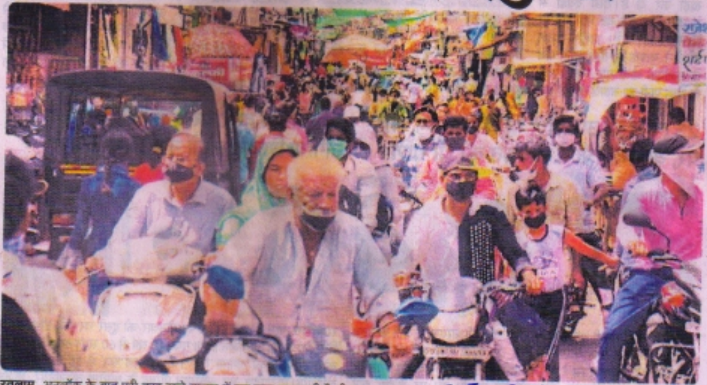
रतलाम. अनलॉक के बाद पूरी तरह खुले बाजार में इस तरह उमड़ रही है भीड़।

शनिवार की शाम से सोमवार सुबह तक के जनता कर्फ्यू के बाद बाजार जब खुला तो एक बार फिर से हर ओर भीड़ के सियाच कुछ नजर नहीं आया। बाजार में सामान्य दिनों से अधिक भीड़ वर्तमान समय में नजर आ रही है। सबसे बुरे हालात शहर के मुख्य बाजारों के हैं, जहां पैर रखने तक की जगह नहीं है। अभी हालात काबू में ही आए हैं कि लोग फिर से लापरवाही बरतने में लगे हुए हैं। बाजार में बढ़ती भीड़ को देख ऐसा लग नहीं रहा कि रतलाम में कभी कोरोना का असर रहा होगा।