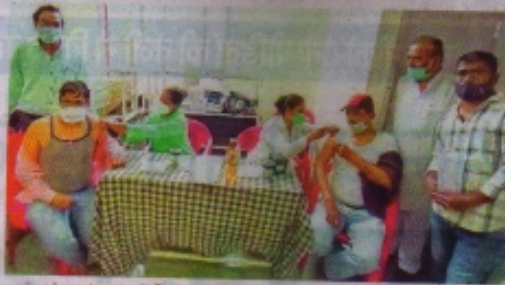
रतलाम के लायस हॉल में टीका लगवते हुए युवा।

मेडिकल कालेज में 512 बेड खाली शासकीय मेडिकल कालेज