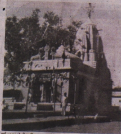
वर्ष 1970 में श्री कालिका माता मंदिर।