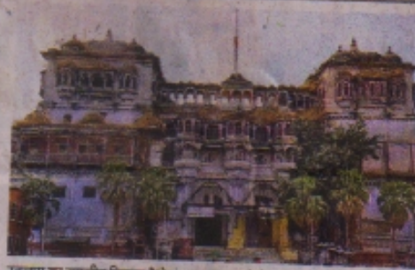
रतलाम का रणजीत विलास पैलेस। ● फाइल फोटो