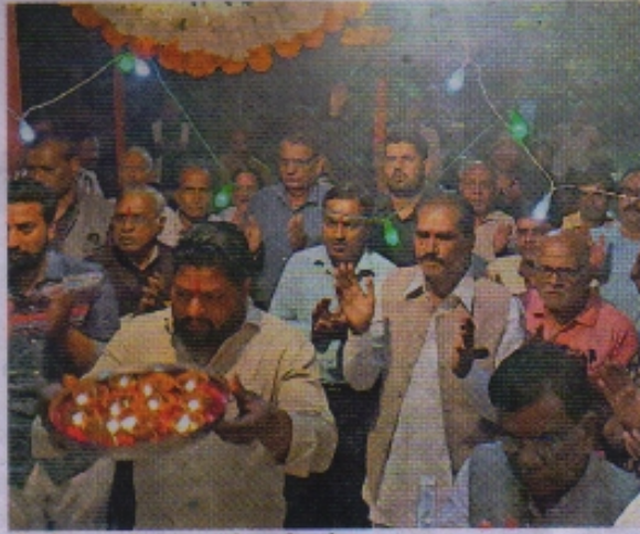
श्री रत्नेश्वर महादेव भगवान की आरती करते हुए भक्तजन।