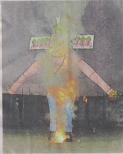
लाइटर से जलाकर रावण के पुतले का किया दहन।

शहर सहित जिले में डेंगू की मरीज बढ़ रहे हैं। इसको देखते हुए निगम प्रशासन ने रावण दहन स्थल नेहरू स्टेडियम में फॉगिंग मशीन का धुआं किया। निगम कर्मचारी ने रावण के पुतले के चारों ओर घूमते हुए धुआं किया। दो दिन में बने 21 फीट के पुतले को जलने में 1 मिनट का समय लगा। इस बार दहन देखने के लिए लोगों की संख्या काफी कम रही, हालांकि प्रशासन ने पूर्व में ही 100 लोगों को अनुमति देने की बात कही थी।