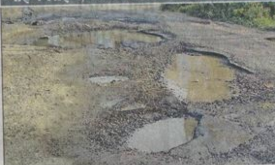
ये है संत रविदास चौक से करमदी रोड। गड़बों के कारण लोग गिर रहे हैं।

पाइप लाइन, सीवरेज और बारिश से जर्जर सड़कों का होगा पेचवर्क