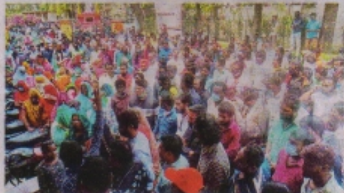
नगर निगम में प्रदर्शन करते हुए आदर्श वाल्मीकि पंचायत, निगम सफाई कर्मचारी संघर्ष समिति के सदस्य।