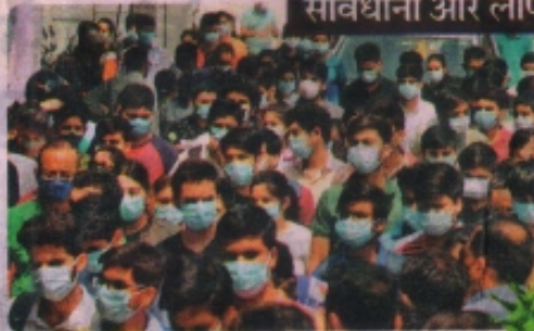
इंदौर, परीक्षा देने आए छात्रों ने सावधानी बरतते हुए मास्क लगाया।