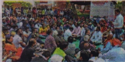
नगर निगम गेट पर धरना देते हिंदू संगठन के पदाधिकारी व सफाईकर्मों संघ