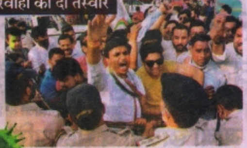
भोपाल, धारा-144 लागू के बावजूद युवां ने ऐसे प्रदर्शन किया।