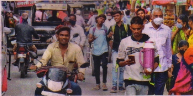
रतलाम के बाजार में बगैर मास्क लगाए घूमते हुए लोग। • नईदुनिया

रतलाम (नईदुनिया प्रतिनिधि)। उतार-चढ़ाव के बीच कोरोना संक्रमण काल को एक साल होने को है। 22 मार्च 2020 को जनता कर्फ्यू और फिर 25 मार्च से लाकडाउन के बाद अब तक 356 दिन में शुरूआती चार माह के बाद कोरोना संक्रमण कभी कम तो कभी ज्यादा होता रहा, लेकिन अब तेजी से मरीज बढ़ रहे हैं। कोरोना की यह दूसरी लहर खतनाक हो सकती है, और सावधानी नहीं बरती तो फिर से लाकडाउन भी लगाना पड़ सकता है। यही वजह है कि अब प्रशासन फिर से सख्ती कर रहा है। शासन स्तर पर भी बुधवार से रात 10 बजे बाजार बंद कराने के निर्देश दिए गए हैं। अभी बाजारों में लोग बगैर मास्क पहने ही दिखाई दे रहे हैं। यह लापरवाही आत्मघाती साबित हो सकती है। मार्च माह के 16 दिनों में प्रतिदिन नए मरीज मिलने का औसत 13 जबकि स्वस्थ होने वालों का औसत पांच है। नए मामले और डिस्चार्ज होने का अंतर लगातार बढ़ने से एक्टिव मरीजों की संख्या 175 हो गई है। इसके पहले छह जनवरी को इतने मरीज एक्टिव थे। मंगलवार को 368 रिपोर्ट में 29 पॉजिटिव मिले और स्वस्थ होने पर नौ डिस्चार्ज किए गए। संक्रमितों का आंकड़ा 4639 व स्वस्थ होने वालों की संख्या 4380 हो गई है। 84 की मीत हो चुकी है। मार्च के 16 दिन में 212 नए मामले मिले, 71 स्वस्थ हुए और दो की मीत हुई। 24 घंटे में शहर के चौमुखी पुल, दीनदयाल नगर, रेल नगर, बखान नगर, कस्तूरबा नगर, हनुमान मंदिर के पास, मंगल मूर्ति, देवरा देवनारायण, राजपूत बोर्डिंग, गुलमोहर कालोनी, रिधि सिद्धि कालोनी, प्री गंज, शास्त्री