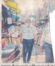
बाजार में उतरकर अतिक्रमण को चेक

कलेक्टर ने स्पष्ट किया कि आमजन के हित एवं शासन हित में विधायक चेतन्य काश्यप की मंशा अनुसार शासकीय भूमि का उपयोग विभिन्न शासकीय योजनाओं, परियोजनाओं में किया जाएगा। विधायक काश्यप द्वारा शहर में उपलब्ध भूमियों के आमजन के हित में सदुपयोग के लिए निरंतर मानीटरिंग एवं कार्ययोजनाएं तैयार