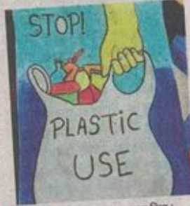
प्रतिभागी द्वारा बनाया गया चित्र।