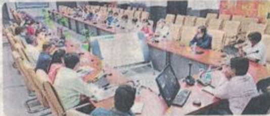
बैठक में अधिकारियों को निर्देश देते कलेक्टर।

तीन दिन में सीएम हेल्पलाइन की 34 शिकायत नहीं कटी तो वेतन रुकेगा फैक्ट फाइल