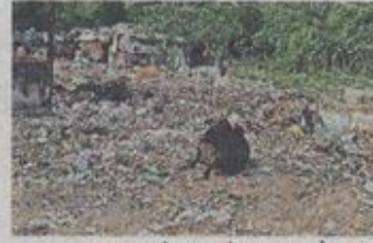
अमृतसागर तालाब के पास में यह ढाल है।