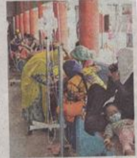
बाल चिकित्सालय में बरामदे में बच्चों को उपचार देना पड़ रहा है।

मंदसौर। शिवना नदी को प्रदूषण दूर करने के लिए तमाम उपायों के बाद भी नदी में गंदगी बढ़ती ही जा रही है। हाल ही में हुए नक्काज विसर्जन के दौरान भी नगर पालिका लोगों को टीक से रोक नहीं पाई और मुक्तिधाम के पास ही फूल मालाएं व अन्य सामग्री जमा हो गई है।