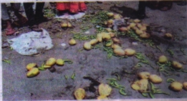
सड़क पर फेंकी गई सड़ी व फल। • नईदुनिया

रतलाम। कोरोना गाइड-लाइन के अन्तर्धान पर निगम व राजस्व अमले द्वारा कार्रवाई कर जुर्माना वसूला जा रहा है। गुरुवार को भद्र रोड फर्ग्यारा चौक पर एक ही स्थान पर फेरी लगाकर फल व सब्जी बेचने से मना करते हुए निगम के अमले ने जुर्माना वसूली तो विक्रेताओं ने नाराजगी जताते हुए फल व सब्जी सड़क पर फेंक दी।