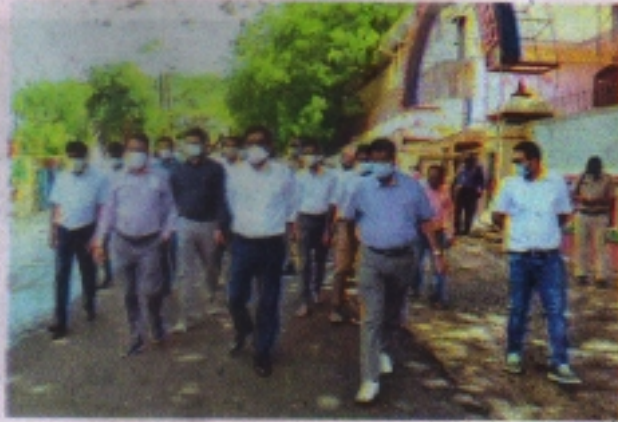
कान्वेंट स्कूल के बाहर निरीक्षण करते हुए कलेक्टर कुमार पुरुषोत्तम।

गुरुवार को मिनी स्मार्ट सिटी प्रोजेक्ट में बन रही सड़कों का निरीक्षण कलेक्टर कुमार पुरुषोत्तम ने निगम आयुक्त सोमनाथ झारिया, एसडीएम अभिषेक गेहलोत व नगर निगम इंजीनियरों के साथ किया। निरीक्षण के निगम आयुक्त ने कान्वेंट तिराहे की सड़क को लेकर कलेक्टर को बताया कि मास्टर प्लान के तहत 12 मीटर चौड़ाई की सड़क का निर्माण किया जाना है। विधायक धेतन्य कारभज के निर्देशानुसार बच्चों की सुविधा के लिए सड़क के दोनों ओर फुटपाथ बनाए जाना है। तिराहे पर 12 मीटर चौड़ाई है, लेकिन