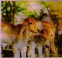
शामिल पशु पालकों को प्लास्टिक टैग लगावाना अनिवार्य किया गया है, ताकि

रतलाम (नईदुनिया प्रतिनिध)। जिले में आधार कार्ड की तरह पशुओं की भी यूनिक आइडी बन रही है। यूनिक आइडी बनने के बाद कोई भी पशु चोरी या गुम होगा तो उसका तुरंत पता लग जाएगा। इसके तहत पशुओं के कान पर प्लास्टिक टैग लगाया जा रहा है। इसमें 12 अंक का एक बार कोड डाला जा रहा है। इस बार कोड में पशु की पूरी डिटेल्स फीड हो रही है।