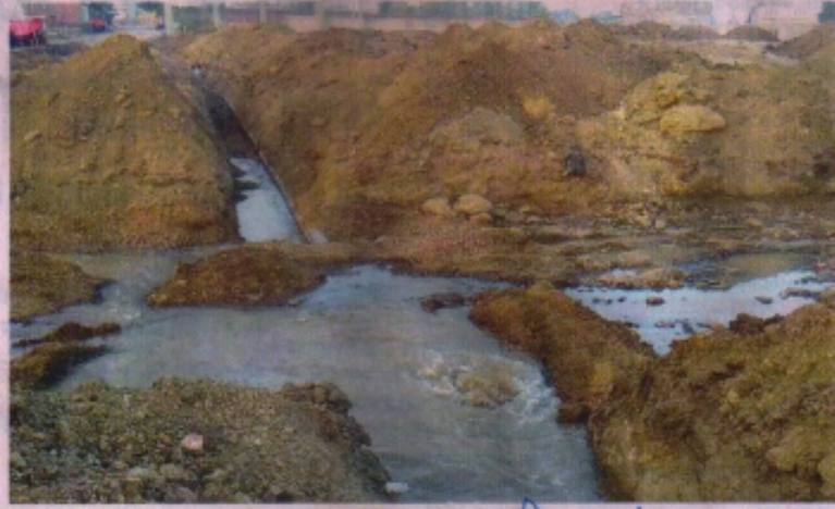
टैकर रोड पर पाइपलाइन फूटने से पानी बहता रहा। • नईदुनिया

रतलाम (नईदुनिया प्रतिनिधि)। नयागांव-टैकर रोड से शिवनगर व आसपास के क्षेत्र में जल वितरण के लिए डाली गई पेयजल लाइन यहां एक कार्लोनी के निर्माण कार्य के चलते क्षतिग्रस्त हो गई। इससे क्षेत्र में जल वितरण प्रभावित हुआ।