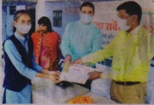
आनंद कॉलोनी स्थित नवीन कन्या स्कूल में छात्र को पुरस्कृत करते हुए निगमायुक्त सोमनाथ झारिया आदि।

यह बात नगर निगम आवृत्त सोमनाथ झारिया ने आनंद कॉलोनी स्थित नवीन कन्या स्कूल में आयोजित स्वच्छता जागरूकता शिविर के दौरान