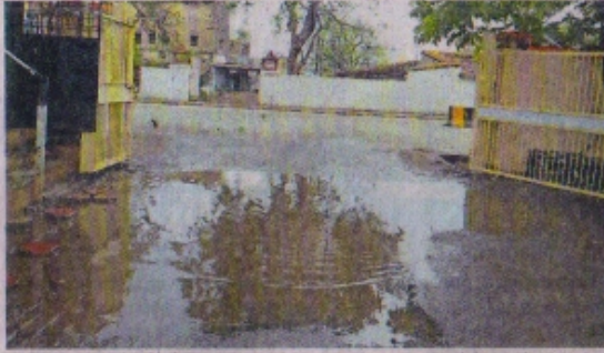
बिजली कंपनी के सिटी ऑफिस के मुख्य गेट पर भरा बारिश का पानी।

रतलाम | पाँवर हाउस रोड फोरलेन बनने के बाद पहली बार बारिश हुई है। कई स्थानों पर रोड कंसा हो गया है नतीजतन कई स्थानों पर पानी भरने लगा है। इससे लोगों को आने जाने में दिक्कत आ रही है। जिन जगहों पर पानी भरा है उनमें बिजली कंपनी स्कूल ऑफिस, सिटी ऑफिस, केन्द्र बैंक के सामने, डीआरएम ऑफिस के सामने, मंडी गेट के सामने और मंडी गेट के सामने राजस्व कॉलेजी वाली गली शामिल हैं।