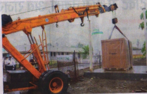
मेडिकल कालेज में आक्सीजन प्लांट का कंपेशर रखती हुई ट्रेन।

रतलाम पहुंचा आक्सीजन प्लांट का कंपेशर, शीघ्र आएं अन्य उपकरण