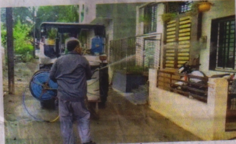
रहावासी क्षेत्र में सैनिटाइजेशन करते हुए निगमकर्मि। नईदुनिया 17/5/21

रतलाम (नईदुनिया प्रतिनिधि)। बीते 10 दिनों से लगातार नए कोरोना मरीजों की संख्या घट रही है, वहीं स्वस्थ होने वालों की संख्या बढ़ रही है। मौत का आंकड़ा भी सोमवार को केवल एक ही रहा था। इससे शासन-प्रशासन के साथ जिलेवासी राहत महसूस कर रहे हैं। मई माह के 18वें दिन मंगलवार को 160 नए पाजिटिव केस सामने आए। तीन की मौत हुई। 377 मरीजों को स्वस्थ होने पर डिस्चार्ज किया गया। अब एक्टिव मरीजों की संख्या 3062 है। जिले में अब तक 16364 पाजिटिव केस सामने आ चुके हैं, वहीं 13031 मरीजों को स्वस्थ होने पर डिस्चार्ज किया जा चुका है। मौत का कुल आंकड़ा 271 पर पहुंच गया है।