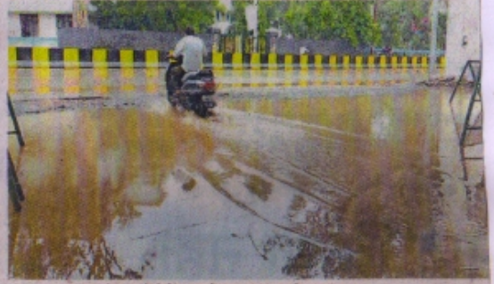
डीआरएम ऑफिस के सामने पेट्रोल पंप के बाहर भरा पानी।