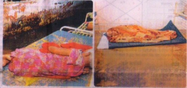
जिला अस्पताल में बारिश के कारण वार्ड में पानी भर गया और पानी-पानी हो जाने से मरीजों की फजीहत हो गई।