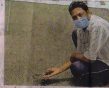
मुख्य रोड पर एक महीने पहले बनाई सड़क की निकली चूरी।