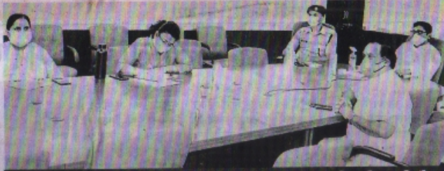
कलेक्टर पुरुषोत्तम ने वीसी लेकर अधिकारियों को दिए दिशा निर्देश

रतलाम। जिले में कोविड-टीकाकरण के महा अभियान का आगाज 21 जून से होगा। अभियान का प्रारंभ उत्सवी माहौल में किया जाएगा। टीकाकरण केंद्रों पर जनप्रतिनिधियों, प्रतिष्ठित नागरिकों की उपस्थिति में टीकाकरण की शुरुआत होगी। अभियान के दौरान 1 सप्ताह में डेढ़ लाख टीके लगाए जाएंगे।