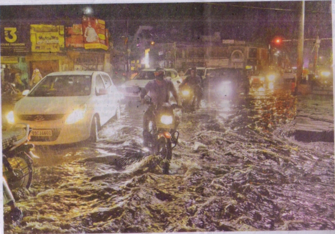
शुक्रवार को बारिश से जलमग्न रतलाम के दो बत्ती चौराहा की सड़क।

19-6-21 रतलाम (नईदुनिया प्रतिनिधि)। जिले में शुक्रवार को मानसून ने अपना पूरा रंग जमा दिया। शहर सहित अंचल में शाम से शुरू हुआ झमाझम का सिलसिला रुक-रुककर लंबे समय तक चलता रहा। इससे कई क्षेत्रों की सड़कें जलमग्न हो गईं और नालों में बहाव शुरू हो गया। जगह-जगह जलजमाव की स्थिति निर्मित हो गई। बारिश से आमजन को गर्मी और उमस से राहत मिली, लेकिन बिजली गूल होने से परेशानी का सामना भी करना पड़ा। जिले में मानसून की जोरदार दस्तक से चारों तरफ खुशियां छुई गईं। शहर सहित आसपास के क्षेत्रों में लगातार चौथे दिन शुक्रवार शाम साढ़े छह बजे झमाझम बारिश का सिलसिला प्रारंभ हुई। दिनभर गर्मी और उमस से बेचैन लोगों को राहत मिली। रिमझिम-झमाझम बारिश का सिलसिला रात तक चलता रहा। बच्चों और युवाओं ने भीगते हुए बारिश का आनंद लिया। शहर में घास बाजार, न्यू रोड, दोबरी चौराहा, लक्ष्मणपुरा, पीपूखीपुल, फावर हाउस रोड सहित कई अन्य क्षेत्रों में सड़कों पर पानी जमा हो गया। तेज बारिश के चलते घास बाजार में मरम्मत के लिए खोले गए नाले का गंदा पानी सड़कों पर बहता रहा। दो बत्ती क्षेत्र में फोरलेन निर्माण के कारण जलभराव हो गया।