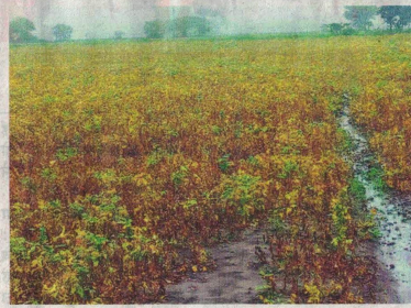
करिया में लगातार बारिश से खेत में पककर तैयार खड़ी सोयाबीन पर प्रतिकूल प्रभाव पड़ रहा है। • नईदुनिया