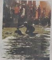
बाइक सहित बहता युवक।