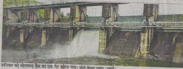
शनिवार को धोलावड़ डेम का एक गेट खोला गया।

इधर, बारिश का दौर शाम 4.45 बजे से शुरू हुआ, जोकि 6 बजे तक जारी रहा। शाम 5.30 बजे तक 10 मिमी पानी बरसा। इधर, 24 घंटे में जिले में 7.7 मिमी बारिश हुई, सबसे ज्यादा आलोट में 22 मिमी बारिश दर्ज की गई। जिले में अब तक 33.70 इंच बारिश हो चुकी है, जो कुल कोट का 93.22% है। सालभर की कुल बारिश 36.15 इंच है। तापमान में सिर्फ 4.6 डिग्री का अंतर : शहर में शनिवार को सुबह व दोपहर में बारिश होने से मौसम में ठंडक हो गई। दिन और रात के तापमान में सिर्फ 4.6 डिग्री का ही अंतर रहा। अधिकतम तापमान 27.2 डिग्री व न्यूनतम तापमान 22.6 डिग्री दर्ज किया गया।