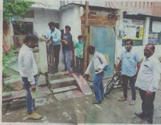
मलेरिया व डेंगू की रोकथाम के लिए दवा का छिड़काव करते हुए कर्मचारी।

एलाइजा टेस्ट में पाजिटिव मिले मरीजों में अब तक 276 स्वस्थ हो गए हैं। इधर बचाव के लिए शहर के चार वार्डों में 467 घरों का सर्वे किया गया। इस दौरान 70 घरों में लार्वा मिला, जिसे नष्ट कराया