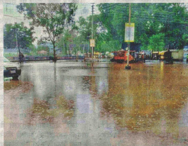
रतलाम में शनिवार शाम बारिश से जगह-जगह जलजमाव हो गया। • नईदुनिया

शनिवार को शहर सहित आसपास के क्षेत्रों में रुक-रुककर रिमिडिम-तेज बारिश होती रही। इससे सड़कें गीली होती रही। सुबह आठ बजे समाप्त हुए बीते चौबीस घंटों के दौरान जिले में 7.7 मिमी पानी बरसा। आलोट तहसील में 22 मिमी, ताल में नौ मिमी, पिपलौदा में 10 मिमी, बाजना में आठ मिमी, रतलाम में पांच मिमी, रावटी में छह मिमी, सैलाना तहसील में दो मिमी पानी बरसा।