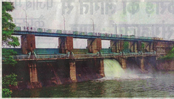
क्षमता से अधिक पानी जमा होने पर धोलावड़ डैम का एक गेट खोला गया।

रतलाम। शहर सहित अंचल में रुक-रुककर हो रही रिमिडिम-तेज बारिश से मौसम खुशनुमा बना हुआ है। जिला अब कुल सामान्य बारिश से महज दो कदम दूर है। जिले में अब तक 850 मिमी बारिश हो चुकी है। गत वर्ष इस अवधि में करीब 1000 मिमी पानी बरसा था। जिले की कुल सामान्य बारिश 918.3 मिमी और अब तक की 845.2 मिमी है। बीते तीन-चार दिनों से हो रही बारिश से कई जलस्रोतों लबालब होकर छलकने लगे हैं। इससे किसान सहित आमजन की चिंता दूर हो गई है। वर्षाकाल में पहली बार शनिवार दोपहर धोलावड़ डैम का एक गेट खोला गया। डैम में 394.95 मीटर पानी आ गया है।