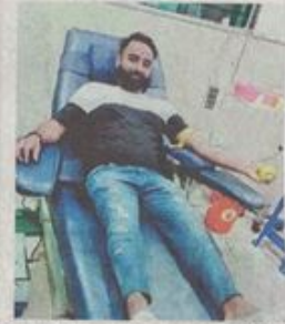
सैलाना में रक्तदान करता युवा।