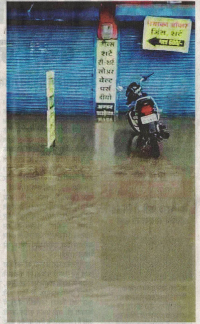
पावर हाउस रोड सिटी फोरलेन पर दुकानों तक पहुंचा पानी।