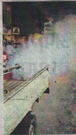
नगर निगम और मलेरिया अधिकारी टीम के साथ फॉगिंग करवा रहे हैं।

दो महीने पहले पॉजिटिव मिलना शुरू हुए, शहर में फॉगिंग शुरू