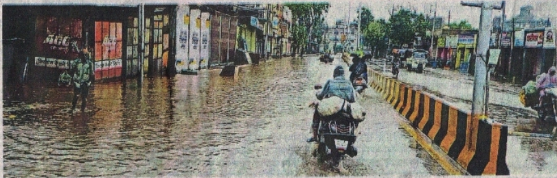
बारिश से पावर हाउस रोड स्थित लहसुन-प्याज मंडी के सामने इस तरह हो गया जलजमाव।