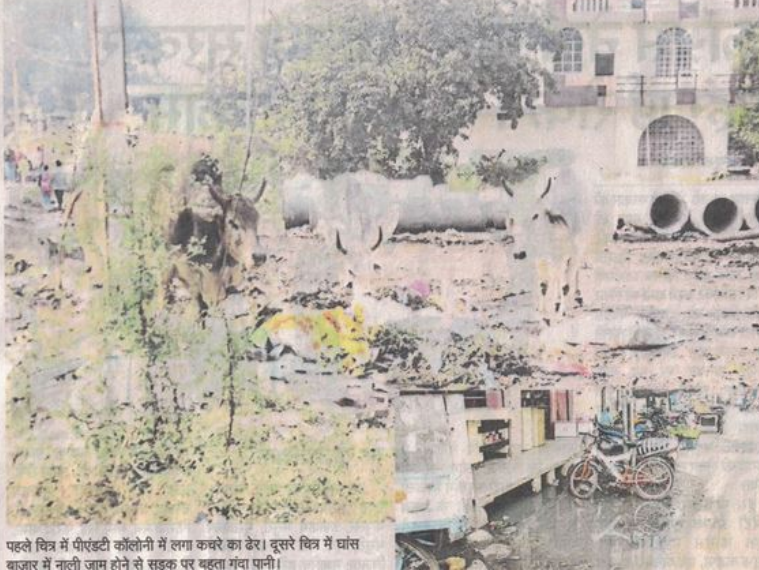
पहले चित्र में पीएंडटी कॉलोनी में लगा कचरे का ढेर। दूसरे चित्र में घांस बाजार में नाली जाम होने से सड़क पर बहता गंदा पानी।

रतलाम, स्वच्छता सर्वेक्षण 2021 के परिणाम शनिवार को सामने आ गए। इसकी ओवर ऑल रैंकिंग में रतलाम देश के अन्य शहरों से मुकाबला नहीं कर पाया। देश के टॉप 50 स्वच्छ शहरों में 49 वें स्थान पर मौजूद रतलाम अब यहां से 113 स्थान नीचे फिसलकर 162 वें स्थान पर पहुंच गया है। वहीं दूसरी ओर प्रदेश के छोटे शहरों में रतलाम प्रदेश में पांचवें पायदान पर आया है, जिसकी खुशी मनाई जा रही है। उनकी माने तो देश में एक से दस लाख तक की आबादी वाले शहरों में रतलाम 42 वें स्थान पर है, जो कि हर बार से बेहतर है। अंकों के आधार पर स्वच्छता में अक्वल आने वाली नगर निगम को शहर में गंदगी और जाम हुई नालियां से सड़क पर बहता