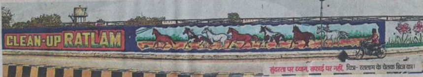
सुंदरता पर ध्यान, सफाई पर नहीं, निगम-रतलाम के पंचक विजय का।

यहां हुई चूक- व्यवस्था सुधारने के प्रयास हुए पर उन्हें शत-प्रतिशत लागू नहीं करवा सके