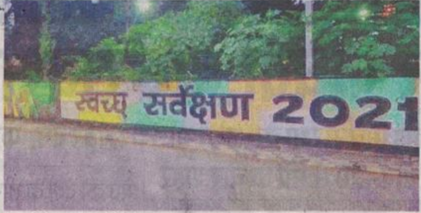
रतलाम की दीवार पर तरह-तरह की पेंटिंग बनाकर स्वच्छता का संदेश दिया गया। • नईदुनिया