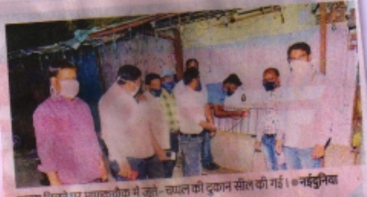
कचरा मिलने पर माणकचौक में जुते-चप्पल की दुकान सील की गई।

रतलाम (नईदुनिया प्रतिनिधि)। नगर निगम द्वारा शहर को जीरो वेस्ट बनाने के लिए क्रमवार बाड़ों को जीरो वेस्ट घोषित किया जा रहा है। माणकचौक बाजार को इसमें लिए जाने के बाद यहां सुबह व रात में कचरा संग्रहण वाहन भेजे जा रहे हैं। इसके बाद भी दुकानों का कचरा सड़क पर डाला जा रहा है।