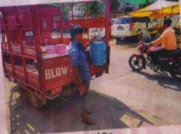
पानी की केन सप्लाई करते हुए ट्रक।

करीब 25 से 30 हजार केन प्रतिदिन बिकती हैं। इसके अलावा शहरी स्मारोह में भी इन्होंने केनों से पानी सप्लाई होता है। गर्मीर बाढ़ यह है कि बोतलबंद पानी का बड़ा बाजार भूमिगत जलदोहन बढ़ा रहा है।