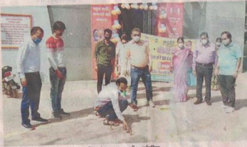
टीकाकरण केंद्र के बाहर आतिशबाजी कर खुशी मनाते हुए स्वास्थ्यकर्मी। • नईदुनिया

रतलाम (नईदुनिया प्रतिनिधि)। देश में कोरोना वैक्सीनेशन अभियान में गुरुवार को 100 करोड़ टीके लगाने का लक्ष्य हासिल किया गया। इसमें जिले में अब तक 18 साल से अधिक आयु वर्ग के 37.78 प्रतिशत लोगों को कोरोना वैक्सीन की दोनों डोज लग चुकी है। तक्रीबन आधी आवादी का वैक्सीनेशन हो चुका है। इसी तरह प्रथम डोज लगवाने वालों का प्रतिशत भी 92.12 प्रतिशत पहुंच गया है। सबसे अधिक रतलाम शहर ब्लॉक में 102 प्रतिशत प्रथम डोज और 63.78 प्रतिशत दूसरी डोज लगी है। सबसे कम बाजना ब्लॉक में 71.66 प्रतिशत प्रथम और 16.98 प्रतिशत दूसरी डोज लगी है। दूसरी डोज में रतलाम शहर ब्लॉक के अलावा सभी का प्रतिशत चालीस से नीचे है।