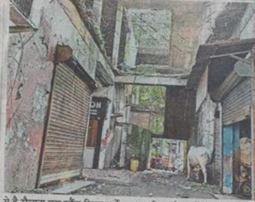
ये है सैलाना बस स्टैंड स्थित मार्केट। नगर निगम ने पहले तो इसे पूरा नहीं बनाया और जितना बना है उतने का मेटेनेंस भी नहीं कराया जा रहा है।

गिरा था। आए दिन यहाँ स्थिति रहती है और मेटेनेंस नहीं होने से छज्जे गिर रहे हैं। वहीं मानव सेवा समिति के बाहर स्थित मार्केट, जिला अस्पताल मार्केट सहित अन्य मार्केटों की यही हाल है और इनके भी छज्जे गिर चुके हैं।