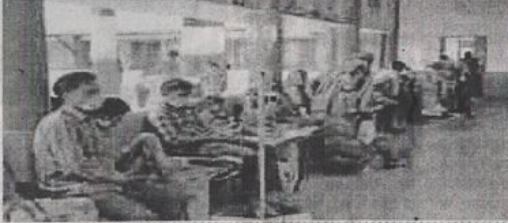
मौसमी बीमारियों में यह है हाल तो तीसरी लहर का कैसे करेंगे सामना

कोरोना की तीसरी लहर की संभावनाओं के चलते बाल चिकित्सालय में बच्चों के उपचार के लिए को गई व्यवस्था जायसल बुखार और डेंगू नाकाफी साबित हो रही है। तीसरी लहर की तैयारी का का दावा करने वाले स्वास्थ्य विभाग और प्रशासन की तैयारियों की हकीकत बरामदे बच्चों से खचाखच भरे बाल चिकित्सालय की हालत से पता की जा सकती है। जिला मुख्यालय पर बच्चों के अस्पताल में बच्चों को बाई तो ठीक बरामदे में भी जगह नसीब नहीं हो पा रही है। गौरतलब है कि 12 दिन पहले ही प्रभारी मंत्री ओ पी एस भदौरिया ने बाल चिकित्सालय में 65 बेड के नवनिर्मित वार्ड का लोकार्पण किया था, लेकिन बाल चिकित्सालय के सभी बेड फूल हो चुके हैं। एक बेड पर दो-दो बच्चों को उपचार देने की नीबत आ गई है।