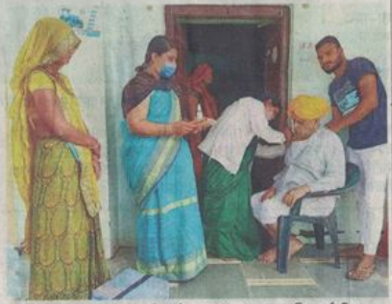
बोदीना में घर पहुंचकर वंचित बुजुर्ग को टीका लगाते हुए स्वास्थ्यकर्मी।

25 सितंबर को ला कालेज आनंद कालोनी, जमातखाना शेरानीपुरा, जिला चिकित्सालय, कन्या विद्यालय कोटारीवास, माणकचौक स्कूल, मोहन टाकीज, माहेश्वरी धर्मशाला कसारा बाजार, बोहरा बाखल कम्युनिटी हाल, जाट धर्मशाला, आइएमए हाल, कुरैशी मंडी मंदरसा, विनोबा स्कूल हाट की चौकी, सिखवाल समाज धर्मशाला, काश्यप सभागृह सागोद रोड, अलकापुरी कम्युनिटी हाल, जिला चिकित्सालय, घटला अस्पताल तथा एमसीएच (गर्भवती महिलाओं के लिए)।