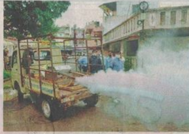
रतलाम में फॉगिंग करते हुए नगर निगम का अमला। • नईदुनिया