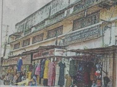
माणकचौक स्थित मार्केट जिसकी छत का अंग्रे का छज्जा कई बार गिर चुका है। बावजूद निगम को रिपेयरिंग की चिंता नहीं है।

नगर निगम हर महीने किराया वसूल रहा, सुभाष कॉम्प्लेक्स की दुकानों की नीलामी की तैयारी