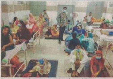
जिला अस्पताल में जमीन पर लेटकर उपचार ले रहे मरीज। • नईदुनिया

रतलाम (नईदुनिया प्रतिनिधि)। जिले में डेंगू के डंक से बच्चे और बड़े सभी परस्त हो रहे हैं। हर दिन डेंगू बुखार के मरीजों की संख्या बढ़ती जा रही है। सरकारी और निजी अस्पतालों में बेड फुल हो गए हैं। महंगे अस्पतालों में उपचार करने से वंचित लोग सरकारी अस्पतालों में फर्श पर लेटकर उपचार ले रहे हैं। गुखवार को जिला अस्पताल लैब की एलाइजा जांच की 27 रिपोर्ट में पांच और मेडिकल कालेज की लैब की 37 रिपोर्ट में 19 नए मरीज मिले। 24 नए मरीजों की एलाइजा जांच में पुष्टि की गई। जिले में अब तक एलाइजा जांच से 364 डेंगू मरीजों की पुष्टि हो चुकी है। किट जांच का आंकड़ा भी तेजी से बढ़ रहा है। जिला अस्पताल में मरीजों को बेड नहीं मिलने से जमीन पर लेटकर उपचार लेना पड़ रहा है। मेडिकल कालेज के चार डेंगू वार्डों में 230 मरीज भर्ती हैं और लगातार नए मरीज उपचार के लिए आ रहे हैं। निजी अस्पतालों में भी मरीजों की संख्या तेजी से बढ़ती जा रही है। शहर के 467 घरों के सर्वे में 43 घरों में लार्वा मिला, जिसे नष्ट कराया गया। गुखवार को भी किट जांच में 50 नए मरीज सामने आए हैं, जो मेडिकल कालेज, जिला अस्पताल व निजी अस्पतालों में उपचार लेने पहुंचे। रिजिडेंट डॉक्टर का