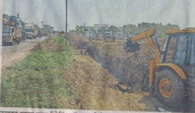
उत्कृष्ट स्कूल तरफ रिटनिंग वॉल बनाने के लिए खुदाई करने के साथ शटरिंग करते ठेकेदार का अमल।

परेशानी : अभी चार से पांच किमी का चक्कर लगाकर जाना पड़ रहा