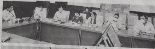
कलेक्टर द्वारा समीक्षा की गई

शुद्धिकरण पखवाड़े में लंबित नामांतरण प्रकरणों का शत-प्रतिशत निपटारा किया जाएगा। फौती नामांतरण कार्य किया जा रहा है। आमजन के लिए नक्शे सुधार किए जा रहे