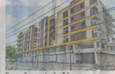
बिल्डर के इस दावे के पीछे का कारण शुरुवार को नगर निगम द्वारा निरस्त की गई निर्माण अनुमति की कार्रवाई को बताया जा रहा है। बिल्डर इसके पहले ही याचिका लगा चुका था। उसके बाद निगम ने यह कार्रवाई कर दी।