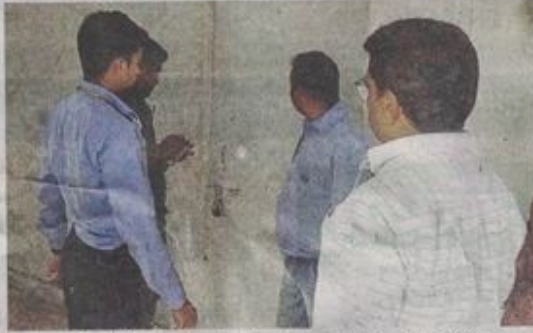
अवैध कब्जे हटाने के बाद फ्लैट पर ताले लगाते हुए निगम अधिकारी।

मालूम हो कि डोसीगांव में पीएम आवास योजना में कुल 396 फ्लैट बनाए गए हैं। झुग्गी बस्तियों के रहवासियों में 177 परिवार को फ्लैट आवंटित किए जा चुके हैं। यह फ्लैट सबसिद्धी देने के बाद दो लाख रुपये जमा कराने पर पांच साल पहले कलेक्टर द्वारा अनुमोदित सूची पर आवंटित किए जा रहे हैं। इसमें भी हितदाही को 20 हजार रुपये ही जमा