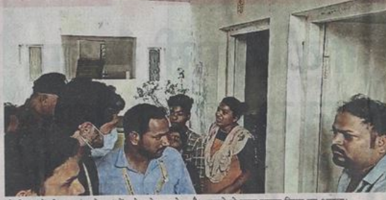
डोसीगांव में पीएमएवाय योजना में बने फ्लैट्स को अवैध कब्जे से मुक्त कराना निगम का अमला।