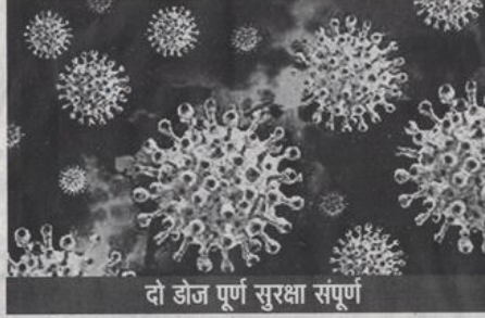
दो डोज पूर्ण सुरक्षा संपूर्ण